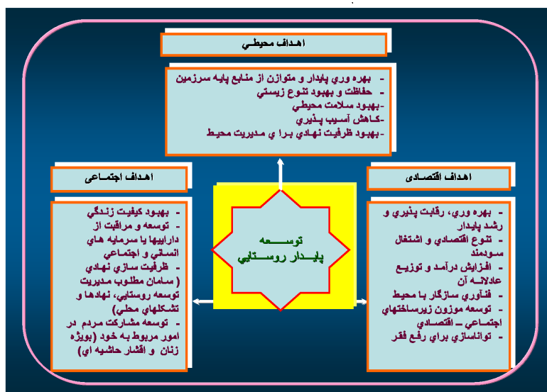
شکل ۱.۱. ابعاد توسعه پایدار روستایی

در همین راستا افزوده شدن پسوندهای موضوعی به واژه توسعه پایدار باعث شده است که دایره کاربرد آن وسیع‌تر شده و موضوعات متنوعی را شامل شود. ظهور کلید واژه‌های علمی چون توسعه پایدار کشاورزی، توسعه پایدار جنگل‌ها، توسعه پایدار منابع آب، توسعه پایدار زمین، توسعه پایدار شهری، توسعه پایدار روستایی و ... نشان از روند گسترش شاخه‌های موضوعی در توسعه پایدار هستند. در این راستا توسعه پایدار روستایی فرآیندی است که در عین داشتن مختصات یاد شده در رابطه با توسعه پایدار، ارتقای همه جانبه حیات روستایی را از طریق زمینه سازی فعالیت‌های سازگار با قابلیت‌ها و تنگناهای محیطی مورد تأکید قرار می‌دهد. واژه محیط می‌تواند در مفهوم گسترده آن اعم از محیط اقتصادی، محیط اجتماعی، محیط ساخته شده و محیط طبیعی باشد.