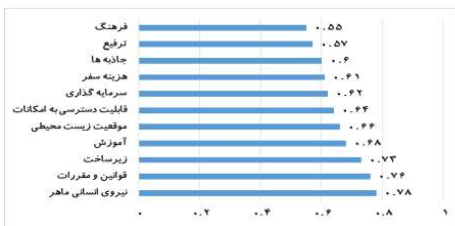
شکل ۲. اولویت بندی مولفه‌های (ابعاد) مدل بازاریابی گردشگری روستایی در شهرستان رودسر

با توجه به شکل (۲)، بالاترین اولویت مربوط به عامل نیروی انسانی ماهر می‌باشد و عوامل قوانین و مقررات، زیرساخت، آموزش، موقعیت زیست محیطی، قابلیت دسترسی به امکانات، سرمایه گذاری، هزینه سفر، جاذبه‌ها، ترفیع و فرهنگ به ترتیب در اولویت‌های بعدی قرار دارند.