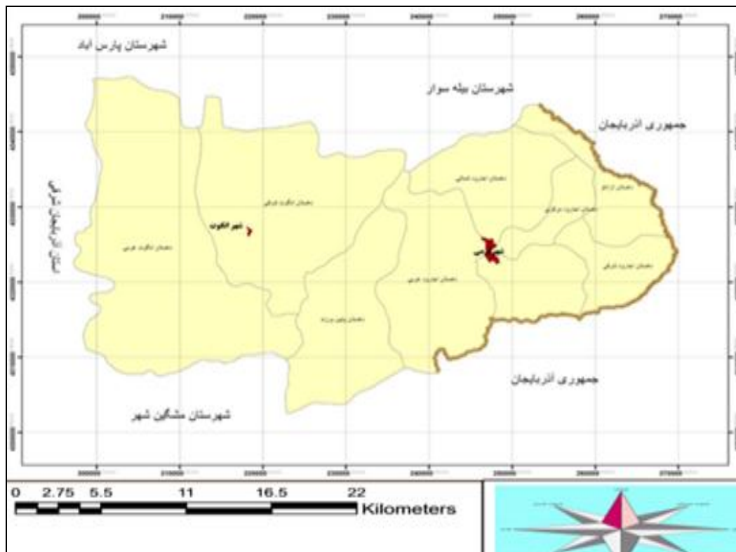
شکل ۱. موقعیت جغرافیایی محدوده مورد مطالعه

همان‌طوری که شکل (۱) نشان می‌دهد شهرستان گرمی در شمال غرب کشور جمهوری اسلامی ایران، در شمال شرق استان اردبیل بین ۳۸ درجه و ۵۰ دقیقه تا ۳۹ درجه و ۱۰ دقیقه عرض شمالی از خط استوا و ۴۷ درجه و ۲۵ دقیقه تا ۴۸ درجه و ۱۲ دقیقه طول شرقی از نصف النهار گرینویچ واقع شده است. شهرستان گرمی از شمال به شهرستان‌های بیله سوار و پارس‌آباد مغان، از جنوب به شهرستان مشکین شهر و جمهوری آذربایجان، از شرق به جمهوری آذربایجان و از غرب به شهرستان‌های کلیبر و اهر در استان آذربایجان شرقی محدود است.