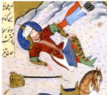
تصویر ۱۶ ( ببریان رستم در شاهنامه ۹۵۳ پاریس، برگ: 71r)

در شاهنامه ۹۵۳ هـ.ق پاریس ببر بیان رستم با ساق‌پوش و ساعدبندی کامل می‌شود. در برخی از نگاره‌ها رستم بدون ساق‌پوش، ساعدبند و گاهی تنها یکی از آن‌ها را دارد که جدولی به منظور بررسی بهتر نگاره‌های مربوط به جنگاوری رستم با ذکر موارد استفاده از ساق‌پوش و ساعدبند تنظیم شده است.