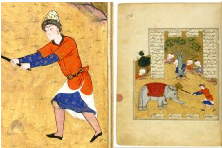
تصویر ۴ ( پیکار رستم با پیل سفید، نگاره ۶، برگ: 54v) تصویر ۵ (پیراهن رو و پیراهن زیر رستم، همو)

پیراهن زیر: پیراهنی آستین‌بلند که در مچ دست تنگ شده و قد آن تا زیر زانوان است. در پایین پیراهن نیز حاشیه‌ای نقش‌اندازی شده است (تصویر ۵).