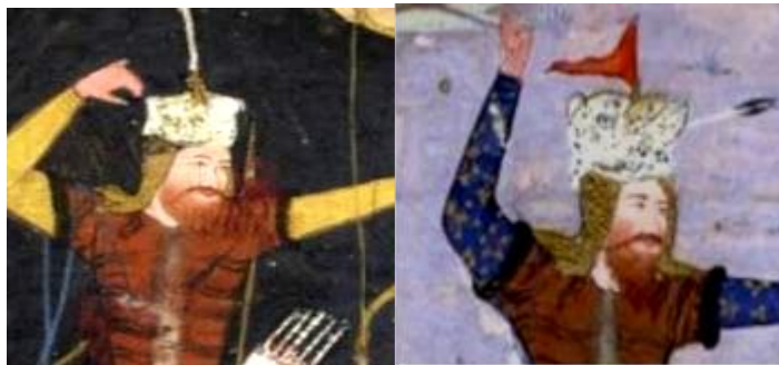
تصویر ۲۰ (نگاه کلاه در نبرد با اسفندیار، برگ: 319r) تصویر ۲۱ (نگاه کلاه به سمت مخالف، برگ: 324r)

نگاره ۴۵ (افتادن رستم به چاه توسط شغاد): نگارگر با ترسیم چشمان باز به سمتی متفاوت از سمت نگاه رستم، قصد دارد نشان دهد که چشمان آگاه کلاه نمی‌خواهد عامل مرگ صاحب خود شغاد بردار رستم و مرگ به دست برادر را ببیند. گویی چشمان کلاه خود را نامحرمی می‌داند که شایسته نیست جور و ظلم روزگار را از دستان برادری بر برادر دیگر را نگاه کند (تصویر ۲۱).