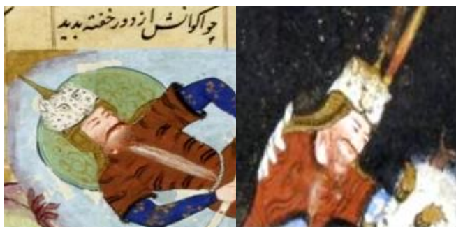
تصویر ۱۸ (چرخش کلاه در نبرد با دیو سپید، برگ: 75v) تصویر ۱۹ (چرخش نگاه در نبرد با اکوان دیو، برگ: 192v)

نگاره ۳۰ (رستم و اکوان دیو): رستم در خواب است، اما چشمان کلاه بیدار بوده و چهره کلاه رو به سمت اکوان دیو و مرکز تصویر است. در ضمن اکوان دیو نیز در مرکز دید بیننده قرار دارد. بنابراین چشمان بیدار کلاه، هم اکوان دیو را می‌نگرد و هم بیننده را نگاه می‌کند. در واقع رستم در خواب و ناآگاه است، اما چشمان هوشیار کلاه اوضاع را و حضور دشمن را درک کرده است و این در حالی است که تلاقی نگاهی با بیننده دارد و بیننده و چشمان کلاه هر دو خطر را احساس می‌کنند (تصویر ۱۹).