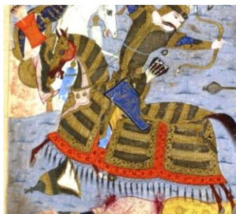
تصویر ۲۶) پوشش اسب اولاد دیو، برگ: 73v

بالاپوش اسب اولاد دیو: پوشش اسب وی همانند پوشش کامل رخس رستم است، اما از جنس آهنین که با جنسیت خفتان اولاد دیو هماهنگی پیدا کرده است. این پوشش متشکل از تکه فلزی روی صورت اسب و تکه‌ای قرمز رنگ مستطیل‌شکل بر روی گونه اسب است. تکه‌ای ترنج‌وار یا اشکی‌شکل نیز به رنگ طلایی روی سینه که در بالای آن اشکی کوچک‌تر در زیر گلوی اسب قرار گرفته است. در کنار قطعات نام برده، تکه‌ای مستطیلی روی گردن اسب - تکه بیضی روی پشت - سه تکه مستطیل‌شکل که پهلو و پشت اسب را می‌پوشاند و در پایین پای اسب مختوم به نخ‌های در هم تنیده وجود دارد (تصویر ۲۶).