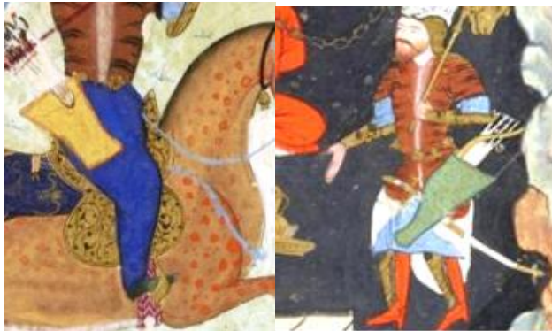
تصویر ۸ (پیراهن زیر، نگاره ۱۴، برگ: 75r) تصویر ۹ (شلوار رستم، نگاره ۲۷، برگ: 181v)

خفتان: خفتانی پوستین‌مانندِ جلو بازی که با دکمه‌های ریزی بسته شده است و آستین آن کوتاه است. در برخی از نگاره‌ها دور لبه آستین و یقه، نواری از خز فرا گرفته (تصویر ۱۰) و گاهی خفتان مذکور بدون خز در یقه است (تصویر ۱۱).