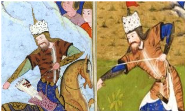
تصویر ۱۰ (خفتان با یقه خز، نگاره ۱۱، برگ: 73r) تصویر ۱۱ (خفتان بدون یقه خز، نگاره ۲۶، برگ: 175v)

خفتان: خفتانی پوستین‌مانندِ جلو بازی که با دکمه‌های ریزی بسته شده است و آستین آن کوتاه است. در برخی از نگاره‌ها دور لبه آستین و یقه، نواری از خز فرا گرفته (تصویر ۱۰) و گاهی خفتان مذکور بدون خز در یقه است (تصویر ۱۱).