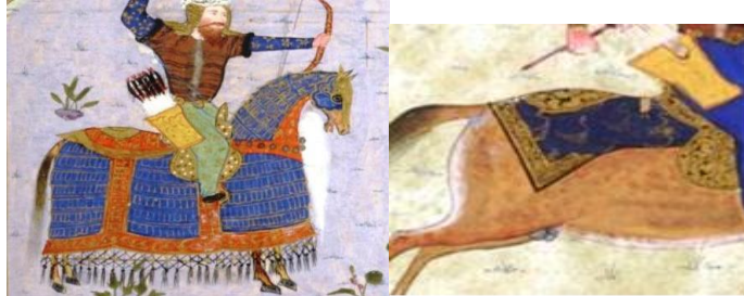
تصویر ۲۲ (تکه پارچه روی رخس، برگ: 181v) تصویر ۲۳ (بالاپوش شماره ۲ رخس، برگ: 319r)

بالاپوش حریف رستم در نگاره مذکور تنها تکه‌ای پارچه، مشابه شکل پوشش شماره ۱ رخس است (تصویر ۲۳).