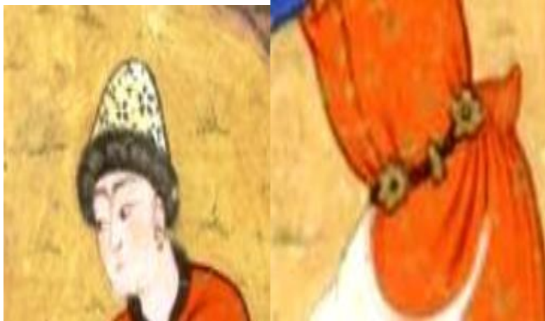
تصویر ۶ (کمربند رستم، نگاره ۶، برگ: 54v) تصویر ۷ (کلاه رستم، همو)

کمربند: به صورت تسمه‌ای که روی آن قطعات شکل گل در جلو و دو پهلوی آن قرار گرفته و مابین فرم گل، قطعاتی مستطیلی باریک قرار دارد (تصویر ۶). پوشش سر: کلاهی به فرم مخروط ناقص با برگردان خز که دور کلاه را فراگرفته و پارچه کلاه نیز منقوش به گل‌هایی کوچک است (تصویر ۷).