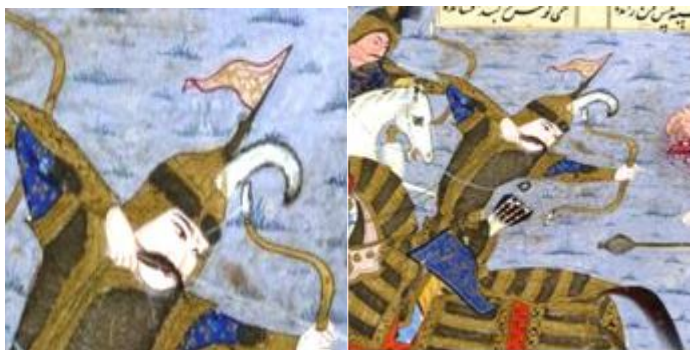
تصویر ۲۴ (خفتان اولاد دیو، برگ: 73v) تصویر ۲۵ (کلاه خود اولاد دیو، برگ: همان)

کلاه خود اولاد دیو: کلاه خود از ریخت زنجیروار خفتان تبعیت کرده و به قسمت کروی کلاه، زنجیرهای یک‌پارچه‌ای که از یک سمت صورت به پشت سر رفته و تا سمت دیگر صورت را پوشانده و تا حوالی شانه‌ها آویزان است. روی آن یک جقه و پرچم سفیدی نصب گردیده است (تصویر ۲۵).