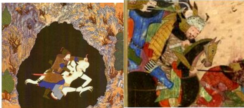
تصویر ۱۴ (ببر بیان در شاهنامه ۸۴۴ پاریس، برگ: 200v) تصویر ۱۵ (ببر بیان در شاهنامه بایسنقری، برگ: 108)

با توجه به آن چه ذکر شد می‌توان برای ببر بیان روی‌کردی تاریخی و هم‌چنین اساطیری قائل شد. اما آن چه از نگاره‌های نسخ مصور هویدا است، ظاهراً نگارگران در نمایش ببر بیان به شباهت تاریخی با پوشش سرداران هخامنشی و شباهت اساطیری با پوشش آناهیتا توجه‌ای نکرده‌اند (تصاویر ۱۴ و ۱۵ و ۱۶)، بل که با وجود شباهت فرم در ببر بیان، در نسخ مختلف نوعی تأثیرپذیری از نگارگری روایی مشاهده می‌شود.