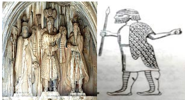
تصویر ۱۲ پوشش مادها (دیاکونوف، ۱۳۴۵: ۳۳۸) تصویر ۱۳ پوشش آناهیتا، تاق بستان کرمان‌شاه)

شایان ذکر است که در فارسی باستان، واژه بیان معنای خدایان را داشته است (سودآور، ۱۳۸۰: ۱۶۷). هم‌چنین در اوستا ، سرورد مربوط به آناهیتا «الهه آب‌ها» در آبان یشت، آناهیتا با لباس و آستین‌هایی بلند توصیف شده که روی لباس در زیر سینه، بندی بسته و بر روی این ردا، تن‌پوشی از خز بر شانه‌ها افکنده است (Gropp, 1996: 752) (تصویر ۱۳).