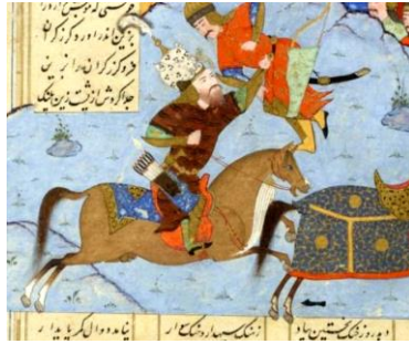
تصویر ۱۷ (جنگ رستم با افراسیاب بار اول، برگ: 66v)

نوعی پیش‌آگاهی و بدون توجه به داستان اصلی، رستم را با این کلاه به تصویر می‌کشند (اکبری مفاخر، ۱۳۹۵: ۲۵۳).