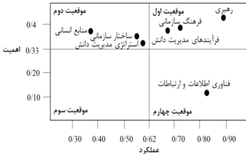
شکل شماره ۴: جانمایی ابعاد بلوغ مدیریت دانش در ماتریس تحلیل اهمیت-عملکرد

شکل ۴، جایگاه هر یک از ابعاد بلوغ مدیریت دانش را در ماتریس تحلیل اهمیت- عملکرد نشان داده است.