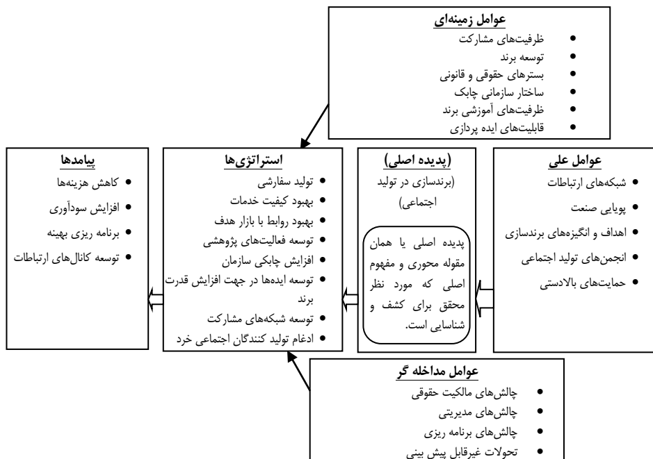
شکل شماره ۲. الگوی پارادایمی برند سازی در تولید اجتماعی در راستای بهبود عملکرد صنعت پوشاک داخلی Figure 2: A paradigm model for branding in social production to improve the performance of the domestic garment industry

در این تحقیق برای کدگذاری محوری از استراتژی گراندد تئوری با رهیافت استرواس و کوربین استفاده شد. این پارادایم چهارچوبی منسجم است که به کمک آن می‌توان روابط احتمالی میان مقوله‌ها را مورد سنجش قرار داد و از طرفی دیگر امکان فهم نسبتاً جامع پدیده مورد نظر را فراهم می‌کند، زیرا در آن عوامل علی و زمینه‌ای که موجب روی آوردن کنشگر، به فعالیتی خاص، که همان مقوله محوری است می‌شود، راهبردهایی که برای مدیریت وضعیت پیش‌آمده و تحقق بخشیدن به مقوله محوری اتخاذ می‌شود، عوامل مداخله‌گری که مانع تأثیرگذاری عوامل علی و زمینه‌ای بر مقوله محوری می‌شود، و پیامدهایی ناشی از راهبردهای اتخاذی مشخص می‌شوند. مدل پارادایمی پژوهش حاضر در ذیل ارائه شده است: