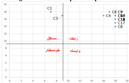
Figure 2: Influence-dependence power matrix