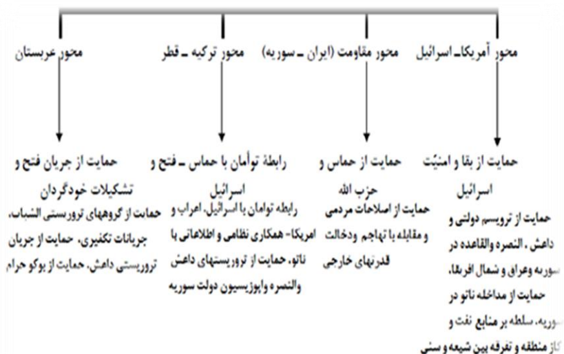
شکل ۱: محورهای رقابت و منازعه ژئوپلیتیکی در خاورمیانه و شمال آفریقا (التیامی نیا و دیگران، ۱۳۹۵: ۱۸۶)

نظرطلبانه در استراتژی‌های کلان خود، توزیع قدرت را به نفع خود متحول کند؛ بنابراین، بین مراحل مقاصد تجدید نظرطلبانه، گرایش‌های تهاجمی، تغییر توزیع قدرت جهانی، حرکت به سمت هژمون و دستیابی به اهداف مطلق، رابطه مسلسل‌وار و پیوسته‌ای وجود خواهد داشت. از نظر مرشایمر، شرایط ایده‌آل برای هر قدرت بزرگ، تنها تبدیل شدن به هژمون منطقه‌ای و جهانی است که در آن صورت، چنین دولتی از الگوی رفتار خارجی تغییر وضع موجود به سمت حفظ وضع موجود، تغییر جهت خواهد داد و به سمت تقویت در خور توجه برای حفظ قدرت موجود حرکت خواهد کرد. (کامل، ۱۳۸۳)