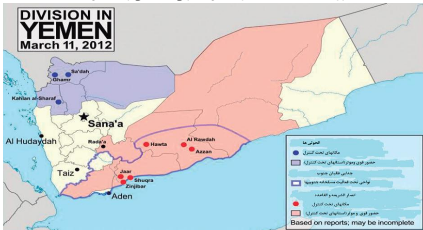
نقشه ۲: ساختار اجتماعی و مکانی بازیگران داخلی یمن (Philips, 2009:4)