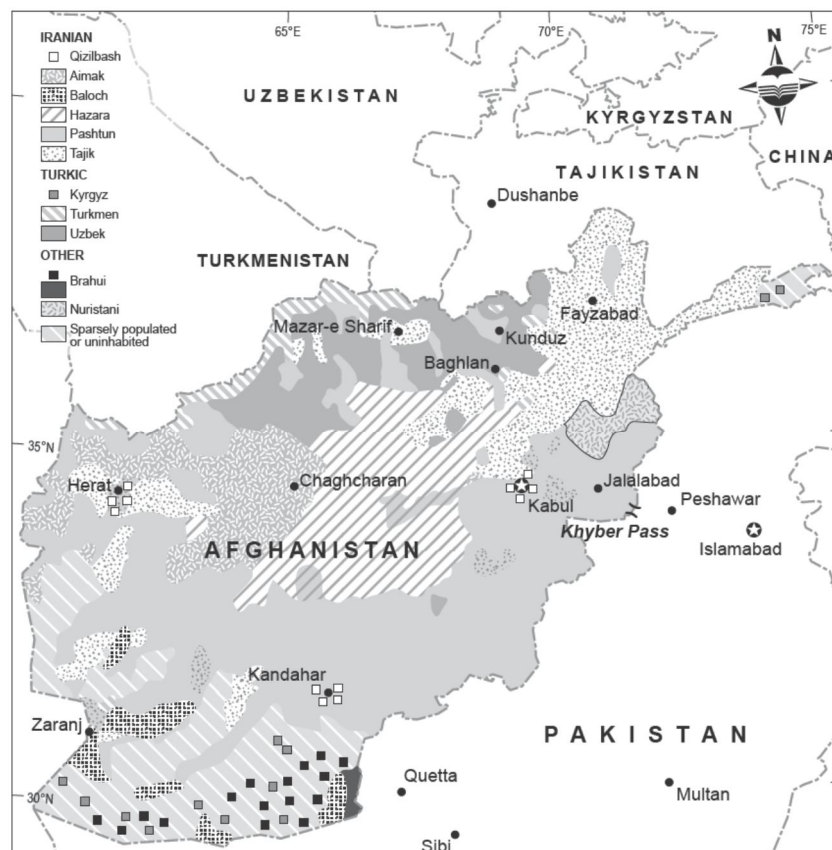
شکل ۲: پراکندگی جغرافیایی اقوام ساکن افغانستان (Tucker, 2010:19)

قومیت پشتون، به دلیل خصلت‌های قوم محورش همواره مشکلاتی برای دولت مرکزی ایران داشته است. این وضعیت حتی در مواقعی که یک ایرانی بر قندهار حاکم بوده نیز صدق می‌کند. واقعیت این است که پشتون‌ها در مقایسه با سایر قومیت‌های افغانستان، مشترکات کمتری با حکومت مرکزی ایران احساس کرده‌اند. تاجیک‌های فارس زبان و هزاره‌های شیعه مذهب، احساس قرابت بیشتری با ایرانیان دارند و این موضوع بسیار مهمی است که در جهت‌گیری‌های ایران، در قبال تحولات افغانستان در مقاطع مختلف زمانی نقش تعیین‌کننده‌ای داشته است. قرابت زبانی و فرهنگی تاجیک‌ها و هزاره‌ها با مردم ایران، در دوره‌ی اشغال افغانستان به وسیله روس‌ها و جنگ داخلی افغانستان و ظهور طالبان کاملاً خود را نشان داد. به این معنا که