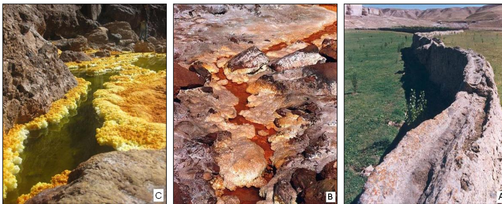
شکل ۳: اژدهای سلیمان، نمونه‌ای از رسوب‌گذاری در بستر و دیواره‌های آبراهه آب گرم (A)، رسوبات نمکی آهن‌دار در آبراهه‌های چشمه‌های معدنی در حاشیه گنبد نمکی هرمز (B) و چشمه نمکی خرسین هرمزگان

مسیری که آب‌های معدنی و گرم خارج شده از چشمه‌ها طی می‌کند نیز جذابیت‌های فراوانی دارد. رسوب‌گذاری رسوب‌های متنوع، جلبک‌ها و لجن‌های بستر آبراهه‌ها و بروز پدیده‌هایی مثل بالا آمدن کف آبراهه و یا کم عرض شدن و تغییر شیب بستر در اثر رسوبگذاری مداوم از موارد جالب در این رابطه می‌باشند. از جمله دیدنی‌ترین آبراهه‌های چشمه‌های آبگرم می‌توان به مسیر آب در چشمه تخت سلیمان واقع در استان آذربایجان غربی اشاره کرد که رسوب‌گذاری رسوب‌های کربناته در بستر و کناره آبراهه در طول زمان دیواره‌ای پر پیچ و خم و طولانی (موسوم به اژدهای سلیمان) را ساخته است که در خط‌الرأس آن آب جریان داشته است (شکل ۳). لازم به ذکر است در آبراهه‌های برخی چشمه‌های غیر آبگرم کشور نظیر چشمه‌های کوچک حاشیه گنبد‌های نمکی هرمز و قشم و چشمه‌های فصلی اطراف معادن مس چهارگنبد و دره‌زار کرمان نیز مناظر زیبایی از رسوبگذاری رسوبات مختلف دیده می‌شود (شکل ۳).