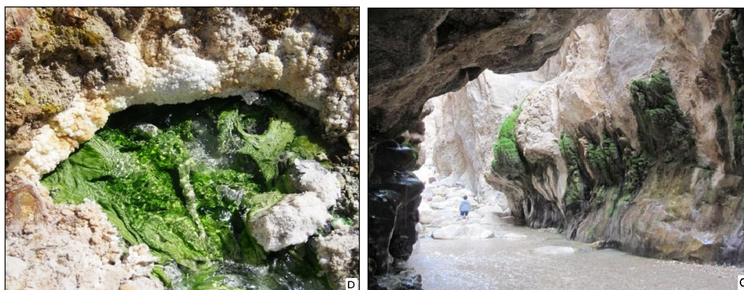
شکل ۴: رسوب‌های پلکانی با تشکیل حوضچه‌های پلکانی و رنگ‌های زیبا در چشمه باداب سورت مازندران (A و B)، تجمع جلبک‌ها در مظهر چشمه‌ها در امتداد دیواره چشمه مرتضی علی طبس (C)، تجمع جلبک‌ها و رسوبات نمکی-گچی در چشمه سنگویه بستک (D)

علاوه بر منطقه باداب سورت، رسوب‌ها و پوشش‌های جلبکی در چشمه‌های دیگری همچون چشمه‌های سنگ‌رود قزوین، محلات اصفهان، گراو مهاباد، زنبیل ارومیه، زندان سلیمان تکاب، شگفتی خوی، شاه‌آباد ماکو، گنبدان گوغر کرمان، خرقان قزوین (املاح کربناته و تراورتن)، چشمه‌های گنو، گچین و تدرویه در هرمزگان، باب‌ترش کرمان، دهلران،