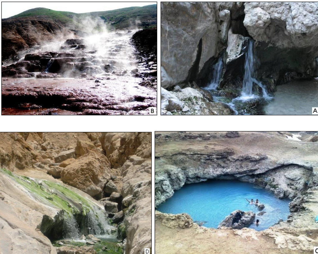
شکل ۲: مظهر خروجی آب در چشمه‌های آبگرم مرتضی علی طیس (A، عکس: طیبسی‌زاده)، گماران بوشهر (B، عکس: هنرکار) و قیرنجه آذربایجان غربی (C، عکس: اوجاقلی) و تدرویه هرمزگان (D، عکس: میرحسینی)

خروج آب از چشمه‌های آبگرم می‌تواند به شکل‌های متنوع از قبیل جوشیدن از کف حوضچه یا دریاچه آبگرم، خروج آب با جریان متناوب کم و زیاد شونده همانند آبفشان‌ها، خروج از شکستگی‌ها و درزه‌ها بصورت آبشارهای کوچک و بزرگ و جریان آب گرم بصورت آبراهه زیرزمینی صورت گیرد که هر کدام زیبایی‌های خاص خود را دارا می‌باشند. به عنوان مثال در چشمه‌های آبگرم ورتون اصفهان، بیشتر چشمه‌های سرعین، تزرچ هرمزگان، جوشان و لاله‌زار کرمان، قیرنجه و چشمه زندان سلیمان در آذربایجان و چشمه آبگرم دهلران خروج آب از کف حوضچه، در چشمه‌های گماران بوشهر، مرتضی علی طیس و یکی از خروجی‌های چشمه تدرویه هرمزگان، خروج آب به صورت جریان آبشار مانند و در چشمه ده‌شیخ در جنوب بافت کرمان، جریان آب گرم به صورت یک آبراهه یا غار زیرزمینی می‌باشد (شکل ۲).