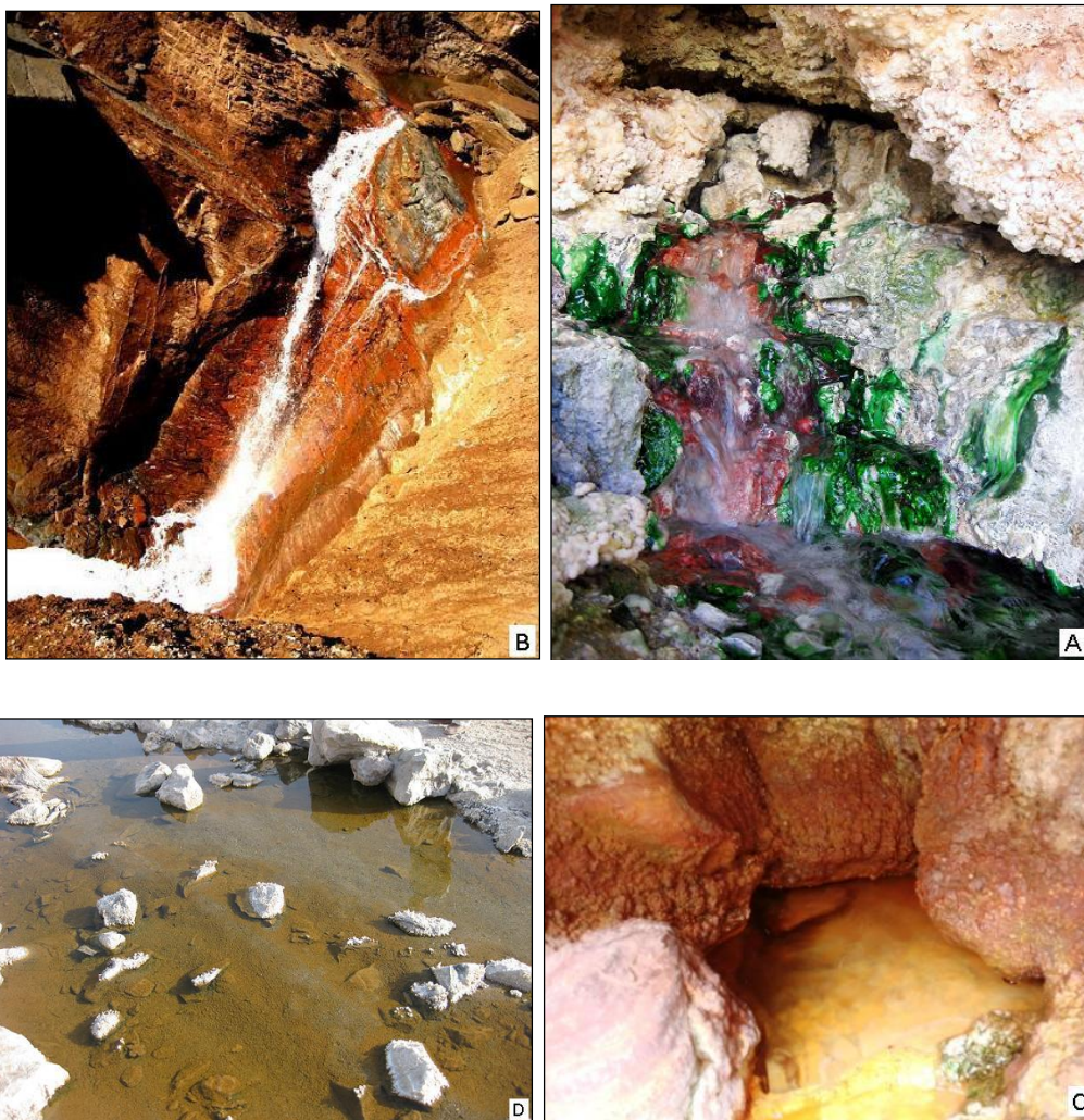
شکل ۵: تصاویری از رسوبات و جلبک‌های متنوع در چشمه‌های آبگرم A: تدرویه هرمزگان، B: گماران بوشهر، C: استراباکو مازندران، D: گچین هرمزگان

چشمه‌های متعدد تفتان در سیستان و بلوچستان (رسوب‌های آهنی، نمکی و گوگردی و جلبک‌های سبز و قرمز)، چشمه‌های زمان‌آباد همدان، تنگز بابا گرگر کردستان، سیه‌چشمه و زی‌سو در ماکو، گماران بوشهر، نی‌دشت رامسر، کلوانس خوی، گراب نیشابور، گرماب قوچان (رسوب‌های قرمز و قهوه‌ای آهن‌دار و رسوب‌های کربناته همراه با املاح آهن و جلبک‌های سبز) دیده می‌شوند که نمونه‌هایی از آن‌ها در شکل‌های ۴ و ۵ نشان داده شده‌اند. لازم به ذکر است رنگ ناشی از املاح، رسوب‌های و پوشش‌های جلبکی در برخی موارد موجب تغییر رنگ آب چشمه‌ها نیز می‌شود.