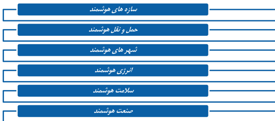
شکل (۱) حوزه‌های کاربردی اینترنت اشیا

کاربرد به استفاده از اینترنت اشیا در صنعت و به‌طور مشخص کسب و کار اشاره دارد. این کاربردها می‌تواند در لایه‌ها و زنجیره کسب و کارها تجلی یابد؛ مانند تامین، توزیع و فروش، انبارداری و غیره در هر یک از صنایع. با وجود این، کاربرد در حوزه اینترنت اشیا بسیار وسیع است، فقط بر حوزه پزشکی و یا حوزه سلامت و حمل و نقل متمرکز نمی‌شود و محققان و نظرسنجی‌های مختلف، کاربردهایی متفاوت را برای صنایع مختلف مورد توجه قرار داده‌اند. یکی از این کاربردها در حوزه هوشمندی است. هوشمندی و کاربرد اینترنت اشیا در هوشمندی، بسیار متنوع است و می‌تواند در صنایع مختلفی ظهور یابد که در ادامه برخی از آنها مورد توجه قرار گرفته‌است. برخی محققان این حوزه مانند ورمسان و فریس (۲۰۱۴) معتقد هستند که حوزه‌های کاربردی برای ورود اینترنت اشیا با تمرکز بر هوشمندی به صورت زیر است.