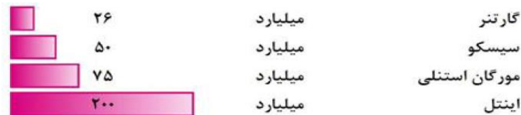
شکل (۳) پیش‌بینی تعداد دستگاه‌ها با قابلیت اتصال به اینترنت در سال ۲۰۲۲

آمارهای اتحادیه‌های مختلف جهانی نشان دهنده افزایش تعداد اشیاء متصل به اینترنت در سال‌های آتی و به دنباله آن افزایش استفاده از اینترنت اشیاء هستند. بنابر پیش‌بینی اینتل در سال ۲۰۲۲، بالغ بر ۲۰۰ میلیارد شیء از طریق اینترنت اشیاء به یکدیگر متصل خواهند بود که در شکل (۳) نمایش داده شده است.