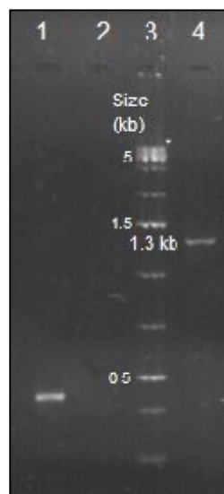
شکل ۴: تصویر الکتروفورز حاصل از تکثیر ژن لیزواستافین در باکتری S. simulans . ستون ۱) کنترل مثبت، ستون ۲) کنترل منفی، ستون ۳) سایز مارکر ۱ kb plus، ستون ۴) باندها نشان دهنده تکثیر صحیح ژن لیزواستافین.

نویسندگان این مقاله از تمامی کارکنان و مسئولین