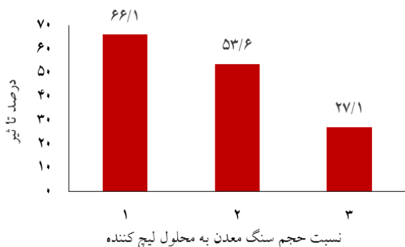
نمودار ۲: تاثیر سطوح مختلف نسبت حجم سنگ معدن به محلول.

فروشوی طلائی مقاوم توسط باکتری‌های بومی بر حسب میلی گرم بر لیتر و درصد جداسازی شده آن در جدول ۳ ارائه شده است. این نتایج نشان می‌دهد که بیشترین درصد فروشوی جدول ۳: نتایج نهایی فروشوی طلائی مقاوم توسط باکتری های بومی.