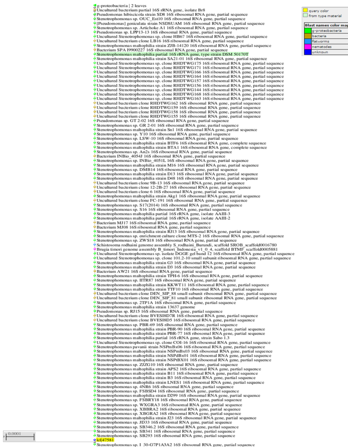
شکل ۱: تصویر درخت فیلوژنی جدایه Ag5، استخراج شده از پایگاه BLAST.

البوغیبیش (Alboghobeish) و همکاران در سال ۲۰۱۴ (۱۸) و کار رفته در مطالعه حاضر می باشد. در این پژوهش، ۷ باکتری نصرآزادانی (Nasrazadani) و همکاران در سال ۲۰۱۱ (۳) به مقاوم به نقره جداسازی شده از نظر میزان MIC مورد بررسی منظور جداسازی باکتری های مقاوم به فلز از محیط کشت PHG II آگار و دمای °C ۳۰ استفاده کردند که مشابه روش به MS8 شناسایی شد، بیشترین