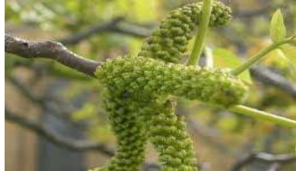
شکل ۱- گیاه گل نر گردو

فاز لگاریتمی رشد باکتری، میزان کدورت ایجاد شده حاصل از رشد باکتری با استفاده از اسپکتروفوتومتر با لوله استاندارد مک فارلند شماره ۰/۵ ( 1/5 \times 10^8 ) تنظیم شد. این سوسپانسیون به عنوان ذخیره در نظر گرفته شده و در هنگام مصرف (در همان روز) به نسبت ۱:۱۰۰ در همان محیط رقیق شد ( 1/5 \times 10^6 ) (Heidari-Sureshjani et al., 2013).