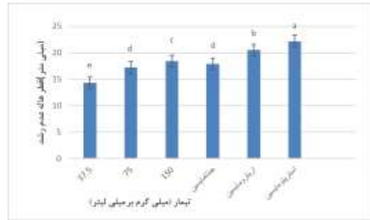
شکل ۴. نمودار مقایسه اثر ضد باکتریایی عصاره آبی گل نر گردو با آنتی‌بیوتیک‌های رایج علیه باکتری لاکتوکوکوس گارویه. حروف غیر همسان دارای اختلاف معنی دار می باشند. ( P < 0.05 )

بر طبق شکل ۴، با توجه به اختلاف معنی‌دار غلظت-های مختلف عصاره نتایج بازگو کننده افزایش اثر ضد باکتریایی عصاره به ازای افزایش غلظت آن‌ها می‌باشد ( P < 0.05 ). هاله عدم رشد در غلظت ۱۵۰ میلی‌گرم بر میلی‌لیتر عصاره آبی، کمتر از هاله عدم رشد آنتی‌بیوتیک اریترومایسین و استرپتومایسین و بیشتر از هاله عدم رشد جنتامایسین بود.