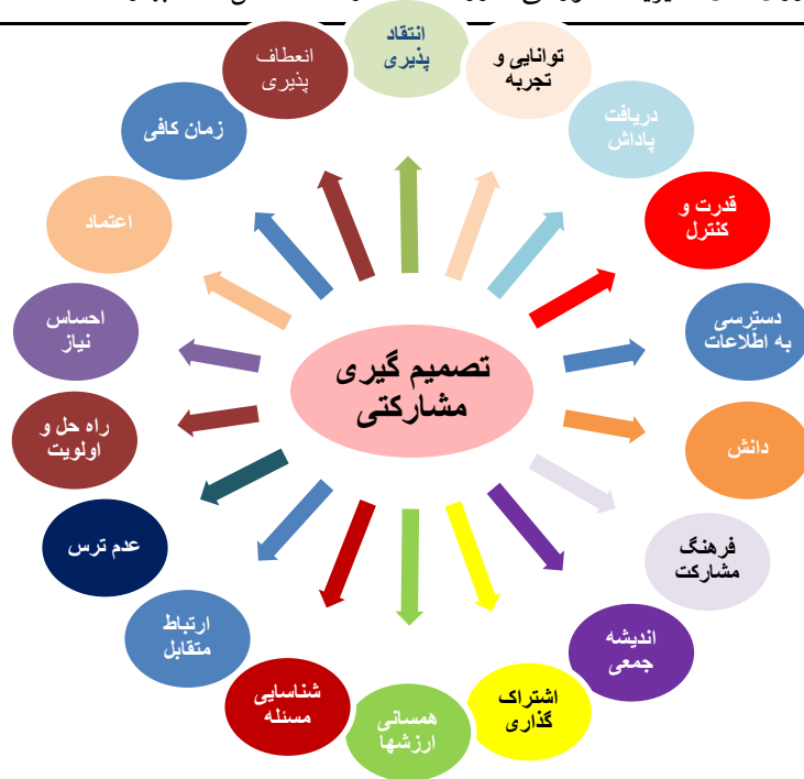
شکل شماره ۲-۱: مدل مفهومی تحقیق (منبع: مبانی و ادبیات تحقیق حاضر)