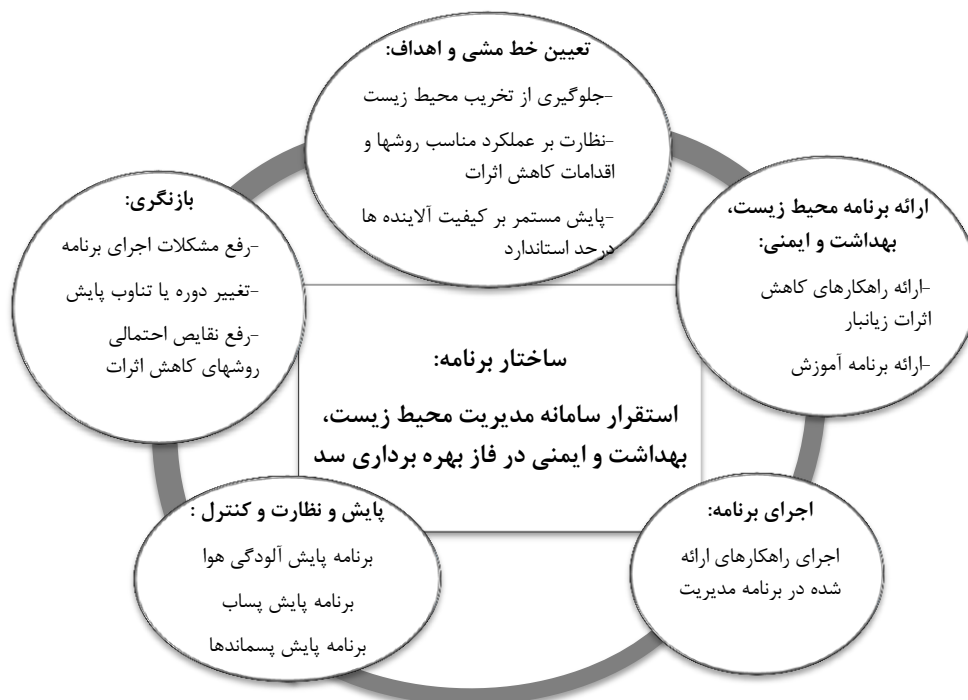
شکل ۳ - ارائه برنامه استقرار سامانه مدیریت محیط زیست، بهداشت و ایمنی (HSE-MS) در فاز بهره برداری سد سردشت در منطقه زاگرس

شیوع بیماری انگلی در مخزن سد است. تجمع مواد آلوده کننده در پشت سدها به مرور زمان، سبب آلودگی جانداران ساکن در رودخانه سد و نیز آلودگی خاک های اطراف سد می گردد و علاوه بر این چون از آب پشت سد برای مصارف گوناگون استفاده می شود، می تواند سبب افزایش انتقال بیماری شیستوسومیس به دلیل پراکنده شدن جمعیت حلزون های حامل، شود. تخریب چشم انداز کمترین اولویت ریسک را بدست آورده است چون در برابر