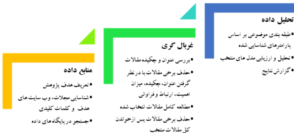
شکل ۲. فرایند انجام پژوهش

هدف از انجام پژوهش حاضر معرفی و ارزیابی مدل‌های آمادگی سازمان برای ورود به صنعت ۴.۰ است. روش پژوهش، مبتنی بر روش نظام‌مند مرور ادبی ۱ ترن فیلد ۲ و همکاران (۲۰۰۳) و سونی و نایل ۳ (۲۰۱۹) بوده که در شکل ۲ قابل مشاهده است.