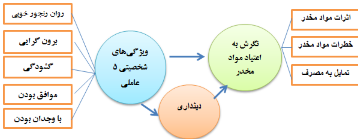
شکل ۱- مدل تحلیلی پژوهش: رابطه بین ویژگی‌های شخصیتی پنج عاملی با دینداری و نگرش به اعتیاد مواد مخدر