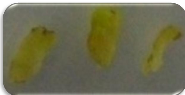
شکل ۲. نمونه کالوس‌های تولید شده در تیمار شماره ۸، ریز نمونه برگ.