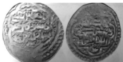
تصویر شماره ۴: سکه طغاتی‌مور-سربداری ضرب سال ۷۴۶ هـ در طوس ۶۶

همچنین، در دوره آی‌تیمور به‌نظر می‌رسد عدم حمایت آل‌جلایر از طغاتی‌مور و ضعف اقتصادی حکومت طغاتی‌موریان، در کاهش ضرب سکه‌های طغاتی‌مور مؤثر افتاده‌است. ۶۷ و طغاتی‌مور در برابر عدم حمایت آل‌جلایر و بحران مشروعیت ایجاد شده، کوشید با درج آیه ۲۶ آل‌عمران «قل اللهم مالک الملک توتی الملک...» بر سکه‌های ضرب نیشابور و جاجرم، به سال ۷۴۷ هـ کسب مشروعیت نماید. ۶۸ همان‌طور که پیش‌تر گفته شد درج آیه مذکور توسط هلاکو نیز صورت گرفت، در حقیقت حاکمان کوشیدند از تفکرات دینی مردم تحت حکومت خویش برای استواری بنیان‌های آن استفاده کنند. ۶۹