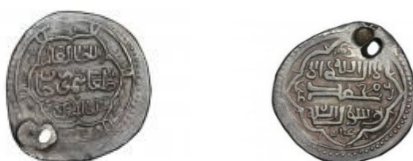
تصویر شماره ۱۷

تصویر نمونه‌ای از سکه‌های سوراخ‌دار دوره طغاتی‌مور که در سال ۷۳۸ هـ و احتمالاً در دامغان ضرب شده است: