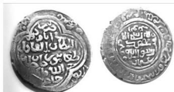
تصویر شماره ۵: سکه طغاتی‌مور: شماره ۴۰، ضرب جاجرم ۷۰

همچنین، در دوره آی‌تیمور به‌نظر می‌رسد عدم حمایت آل‌جلایر از طغاتی‌مور و ضعف اقتصادی حکومت طغاتی‌موریان، در کاهش ضرب سکه‌های طغاتی‌مور مؤثر افتاده‌است. ۶۷ و طغاتی‌مور در برابر عدم حمایت آل‌جلایر و بحران مشروعیت ایجاد شده، کوشید با درج آیه ۲۶ آل‌عمران «قل اللهم مالک الملک توتی الملک...» بر سکه‌های ضرب نیشابور و جاجرم، به سال ۷۴۷ هـ کسب مشروعیت نماید. ۶۸ همان‌طور که پیش‌تر گفته شد درج آیه مذکور توسط هلاکو نیز صورت گرفت، در حقیقت حاکمان کوشیدند از تفکرات دینی مردم تحت حکومت خویش برای استواری بنیان‌های آن استفاده کنند. ۶۹