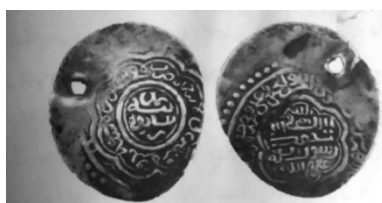
تصویر شماره ۷: سکه علی مؤید ضرب سال ۷۶۳هـ در نیشابور ۹۷