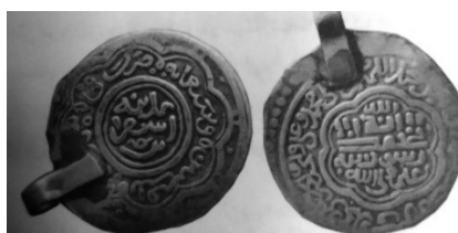
تصویر شماره ۶: سکه علی مؤید ضرب سال ۷۳۶هـ در اسفراین ۹۶

درویش عزیز را مانع قدرت خود می‌دید. ۹۳ بدین دلیل، درویش عزیز را در برابر آل‌کرت حمایت نکرد و اقدام به تعقیب و قتل تعدادی از یاران درویش عزیز کرد. این امر موجب پناه آوردن عده‌ای از درویشان به ملک غیاث‌الدین پیرعلی حاکم آل‌کرت گردید که پس از مدتی از وجود آنان علیه سرداران استفاده کرد. ۹۴ این شرایط بدون شک موجب نابسامانی و آشفتگی در حکومت سرداران و کاهش قدرت سیاسی-اقتصادی آنان شد و برنظام ضرب سکه نیز اثر گذاشت، چراکه بنابر مطالعات سکه‌شناسی در فاصله سال‌های ۷۵۹-۷۶۲هـ، هیچ سکه‌ای به نام سرداران ضرب نشد تا اینکه در سال ۷۶۳هـ علی مؤید به نام خود سکه ضرب کرد. ۹۵