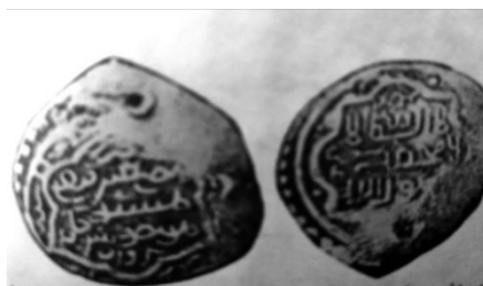
تصویر شماره ۳: سکه طغاتی‌مور-سربداری ضرب سال ۷۴۶ هـ در سبزوار ۶۵

امیرمسعود سربداری با طغاتی‌مور تا سال ۷۴۵ هـ با تسامح و تساهل پیش رفت و ضرب سکه در دامغان و سبزوار به نام طغاتی‌مور تداوم یافته است. ۶۱ پس از مرگ امیرمسعود شرایط حاکم به گونه‌ای رقم خورد که تهدیدهای حکومت سنی آل‌کرت، مانع تداوم و گسترش شعارهای شیعی شد و حمایت طغاتی‌مور از آنان موجب نفوذ سیاسی وی در قلمرو سربداران گردید. نخستین جانشین امیرمسعود سربداری «محمدآی تیمور» (۷۴۵ هـ) در ابتدای حکومت خود، به سیاست محافظه‌کارانه‌اش در برابر طغاتی‌مور ادامه داد. بنابراین، ضرب سکه‌های طغاتی‌مور در شهرهای بازار و سبزوار ۶۲ و طوس استمرار داشت، ۶۳ اما با مرگ امیر ارغون‌شاه، حاکم جانی‌قربانی در سال (۷۴۳ هـ) سیاست صلح یا بی‌طرفی محمدبیک قربانی نسبت به سربداران اتخاذ شد. ۶۴ با توجه به اطلاعات به دست آمده از سکه‌ها، این امر فرصتی به‌آی تیمور داد تا سکه ضرب کند. هر چند این سکه‌ها به‌طور مشترک توسط آی تیمور و طغاتی‌مور و تحت تأثیر نگرش دینی طغاتی‌مور و به سبک سنی ضرب شده‌اند، اما نکته درخور تأمل این است که، تلاش آی تیمور نیز در راستای احیای هویت سربداران بوده است.