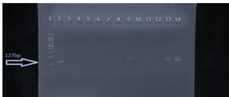
شکل ۳- نتیجه الکتروفورز محصولات PCR ژن sea چاهک ۱: مارکر ۱۰۰۰ bp، چاهک ۲: کنترل مثبت، چاهک ۳: کنترل منفی، چاهک‌های ۱، ۳، ۴، ۶، ۷، ۸، ۱۰، ۱۱، ۱۲، ۱۳، ۱۴: نمونه‌های مثبت (تشکیل ۱۲۷ جفت بازی)