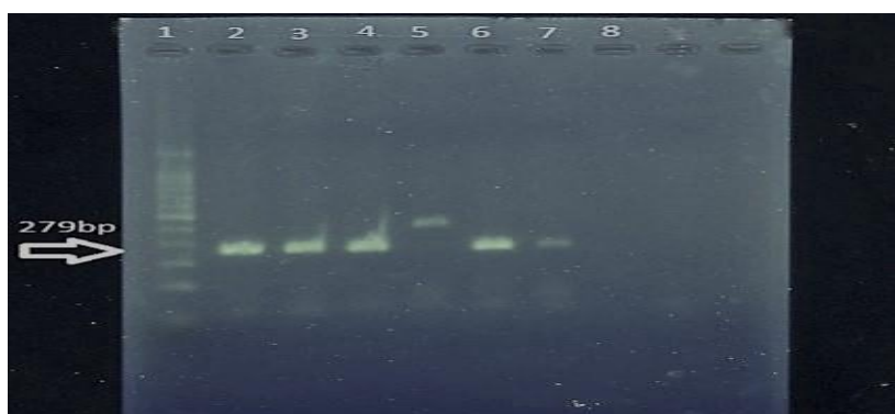
شکل ۱- نتیجه الکتروفورز محصولات PCR ژن nuc چاهک ۱: مارکر ۱۰۰۰ bp، چاهک ۲: کنترل مثبت، چاهک ۳، ۴، ۶ و ۷: نمونه‌های مثبت (تشکیل قطعه ۲۷۹ جفت بازی)، چاهک ۸: کنترل منفی

در این تحقیق آلودگی به جنس استافیلوکوکوس با توجه به نتایج کشت بر روی محیط برد پارکر آگار در ۴۱ نمونه (۸۲ درصد) مشاهده شد بر اساس نتایج کشت بر روی محیط بلاد آگار، ۱۰ نمونه دارای همولیز بتا بودند. ۱۴ نمونه بر روی محیط مانیتول سالت آگار رشد کردند. تست