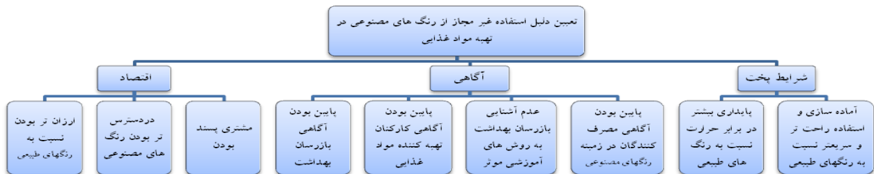
شکل (۱) - ساختار سلسله مراتبی تعیین علل استفاده غیرمجاز از رنگ مصنوعی در تهیه مواد غذایی

مشتریان به شیرینی‌های رنگ شده با رنگ‌های مصنوعی به دلیل تنوع آن‌ها انتخاب شد. برای معیار آگاهی زیر معیارهای پایین بودن آگاهی بازرسان بهداشت، پایین بودن آگاهی تهیه‌کنندگان مواد غذایی، پایین بودن آگاهی عموم مردم به عنوان مصرف‌کنندگان مواد غذایی و عدم آشنایی بازرسان بهداشت به روش‌ها و فنون آموزش و برای معیار شرایط پخت پایداری بیشتر رنگ‌های مصنوعی در حرارت و شرایط پخت و آماده‌سازی و امکان استفاده راحت‌تر و سریع‌تر از رنگ‌های مصنوعی نسبت به رنگ‌های طبیعی انتخاب شد. شکل شماره یک ساختار سلسله مراتبی فوق را نشان می‌دهد.