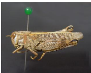
Figure 27. C. coelesyriensis