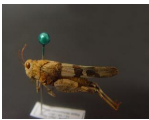
Figure 17. Oedipoda miniata