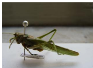
Figure 33. Tettigonia viridissima