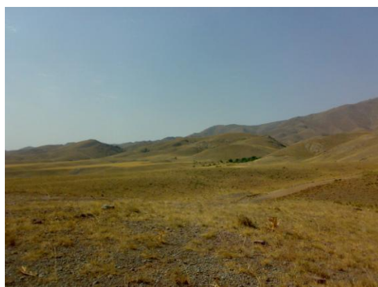
شکل ۸- منطقه‌ی نمونه برداری سوراوجین: کوهستانی. بافت خاک: ۹۵ درصد سبک و ۵ درصد نیمه سنگین.