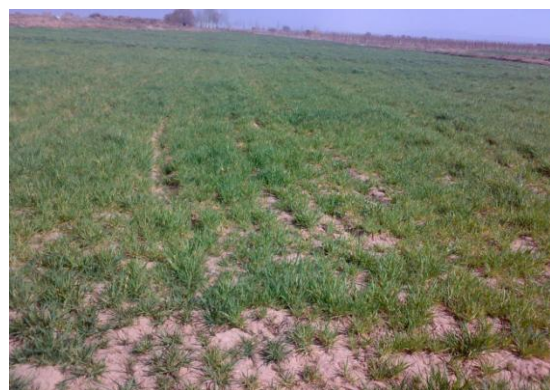
شکل ۳- منطقه‌ی نمونه برداری اسفرورین: دشت هموار. بافت خاک: ۴۰ درصد سبک و ۶۰ درصد نیمه سنگین.