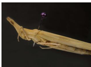
Figure 15. Truxalis robusta