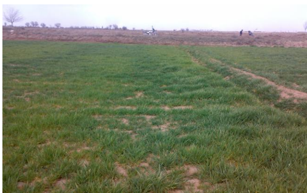
شکل ۲- منطقه‌ی نمونه برداری ابراهیم‌آباد: دشت هموار. بافت خاک: ۹۰ درصد سبک و ۱۰ درصد نیمه سنگین.

توسط تله‌ی نوری، شکار دستی با گوش کردن به آواز آن‌ها و تعیین محل به وسیله‌ی چراغ قوه و نیز تعبیه‌ی تله‌ی افتادنی جمع‌آوری شدند. نمونه‌ها توسط شیشه‌ی سم حاوی سیانور کشته شدند و به آزمایشگاه انتقال یافتند. جهت شناسایی، ویژگی‌های مرفولوژیک اندام‌هایی همچون پیش‌گرده و کارن‌های بخش‌های جلوپی و عقبی آن، رگ‌بندی شبه‌بال‌پوش و شکل اتصالات رگ‌بال‌ها، رنگ، شکل و اندازه‌ی اندام‌های مختلف بدن، طول قسمت‌های مختلف پاها و تعداد خارها، اندام شنوایی روی ساق پای جلوپی یا دو طرف اولین حلقه‌ی شکم، سرک، صفحات زیرجنسی و فوق مقعدی، شکل و تزئینات اندام زادآوری (اپی‌فالوس، فالیک کامپلکس و تیتیلاتور)، دستگاه زادآوری ماده (تخم‌ریز و سایر متعلقات) و ویژگی‌های دیگر مورد توجه قرار گرفت. پس از اتمام شناسایی، نمونه‌ها، با نمونه‌های تیپ کلکسیون موزه‌ی حشرات هایک میرزایانس موسسه‌ی تحقیقات گیاه‌پزشکی کشور مقایسه شد و اسامی علمی آن‌ها مورد تأیید قرار گرفت. همچنین اسامی و وضعیت سیستماتیکی تاکسون‌ها با منابع مرجع (Bisby et al. , 2012) مرور گردید. تمامی نمونه‌ها در موزه‌ی حشرات هایک میرزایانس نگهداری دائمی می‌شوند.