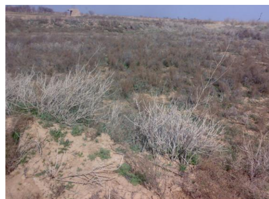
شکل ۵- منطقه‌ی نمونه‌برداری زین‌آباد: دشت هموار. بافت خاک: ۷۰ درصد سبک و ۳۰ درصد نیمه سنگین.