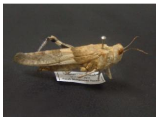
Figure 20. Sphingonotus nebulosus