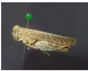
Figure 26. C. barbarous