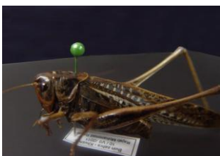
Figure 35. Decticus albifrons