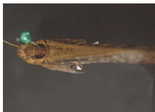
Figure 21. Locusta migratoria