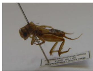
Figure 40. Acheta domesticus