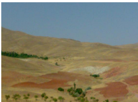
شکل ۶- منطقه‌ی نمونه برداری برزلیجین: تپه ماهور. بافت خاک: ۶۰ درصد سبک و ۴۰ درصد نیمه سنگین.