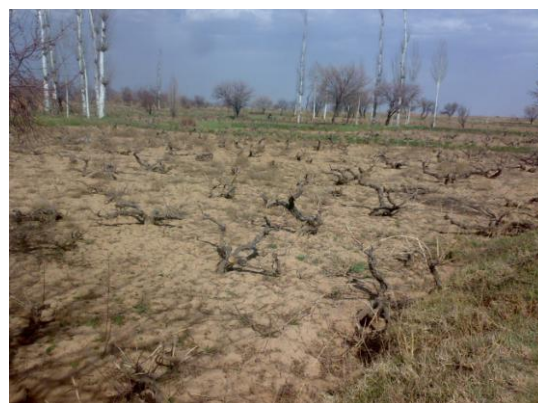
شکل ۱- منطقه‌ی نمونه برداری شال: دشت هموار. بافت خاک: ۷۰ درصد سبک و ۳۰ درصد نیمه سنگین.