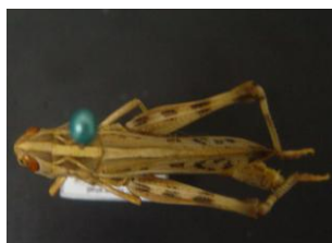
Figure 14. Ramburiella turcoman