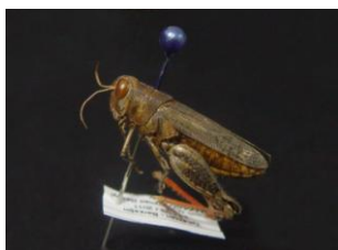
Figure 29. C. tenuicercis