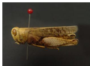
Figure 28. C. turanicus