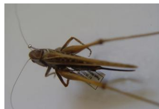
Figure 37. Platycleis intermedia