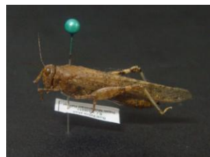
Figure 19. Sphingonotus rubescens