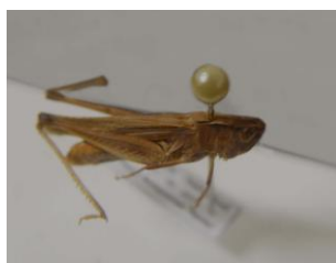
Figure 11. Chorthippus brunneus