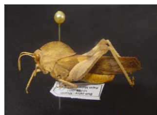
Figure 24. Pyrgoderma armata