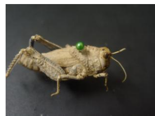
Figure 31. Asiotmethis muricatus