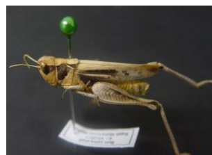
Figure 13. Dociostaurus tartarus