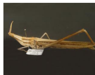
Figure 10. Acrida oxycephala