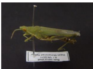
Figure 32. Pyrgomorpha conica