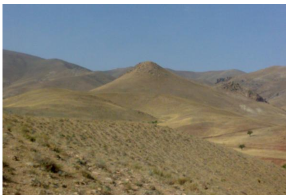
شکل ۴- منطقه‌ی نمونه‌برداری شنستق علیا: کوهستانی. بافت خاک: ۷۰ درصد سبک و ۳۰ درصد نیمه سنگین.