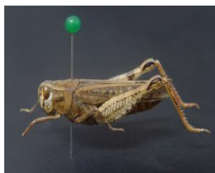
Figure 25. C. italicus