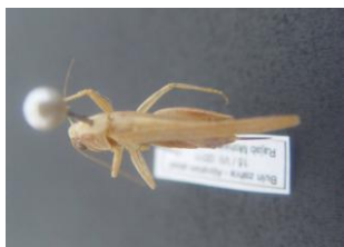
Figure 39. Tessellana tessellata