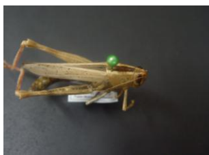
Figure 30. Thisoicetrinus pterosti