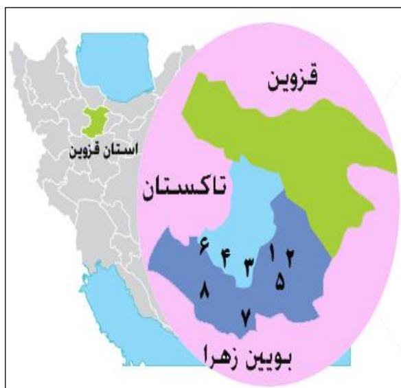
شکل ۹- استان قزوین، شهرستان‌های تاکستان و بویین زهرا و سایت‌های نمونه برداری: شال (۱)؛ ابراهیم‌آباد (۲)؛ اسفرورین (۳)؛ شنستق علیا (۴)؛ زین‌آباد (۵)؛ برزلجین (۶)؛ یزن (۷)؛ سوراوجین (۸) (برگرفته از تارنمای http://www.iran.ir/about/city/qazvin ).