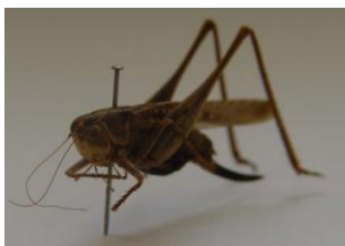
Figure 38. Platycleis affinis