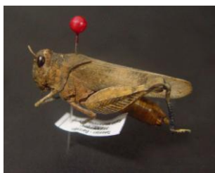
Figure 18. Oedipoda schochi