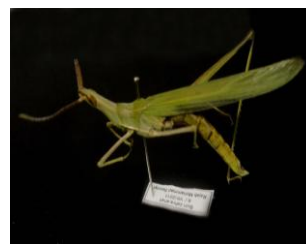
Figure 16. Truxalis eximia