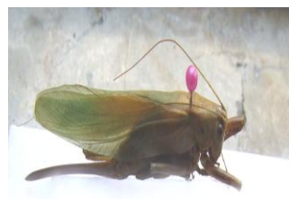
Figure 34. Tettigonia caudata