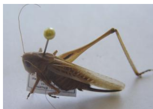
Figure 36. Platycleis escaleraei