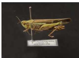
Figure 23. Aiolopus thalassinus