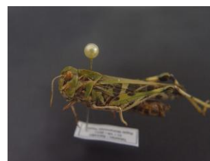
Figure 22. Oedaleus decorus