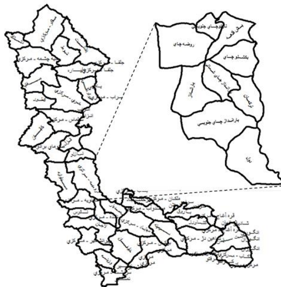
شکل ۲- محدوده دهستان دهستان باراندوز چای جنوبی، بخش مرکزی شهرستان ارومیه Figure 2- South BaranduzChay county areas, the central township of Orumiyeh

اندازه‌گیری می‌شود، این مقدار در این تحقیق برابر با ۰/۸۴ می‌باشد. برای تعیین آگاهی و عملکرد زیستی کشاورزان نمونه در ابتدا با استفاده از آزمون اسطح و عملکرد آن‌ها بررسی شده و سپس همبستگی بین آگاهی و عملکرد زیستی تحلیل شده است.