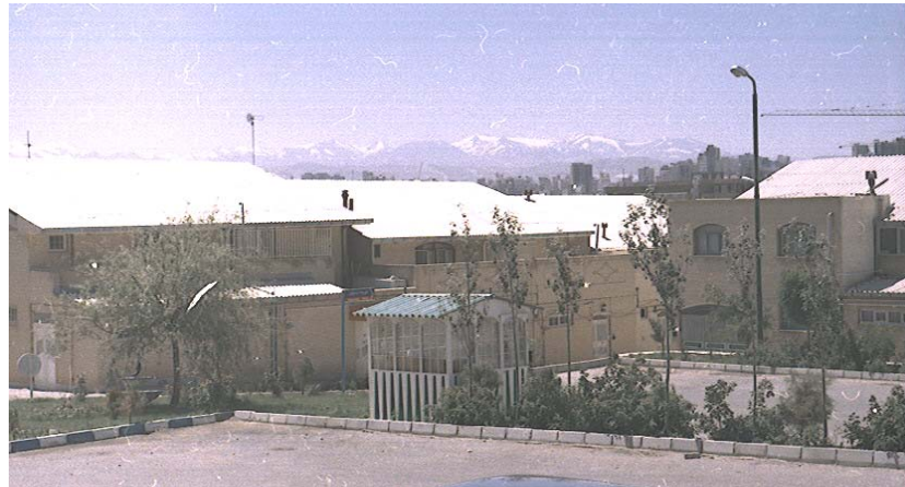
تصویر ۱- فضاهای همسایگی محله رشديه، نمونه طراحی زیست محیطی که با کارکرد اجتماعی-محله ای ترکیب شده است.

محیط زیست می توانند به پایداری زیست محیطی در محلات شهری کمک کنند. نتایج این مطالعه نقش طراحی شهری را در آسایش زیست محیطی محلات مسکونی و ترویج استفاده از