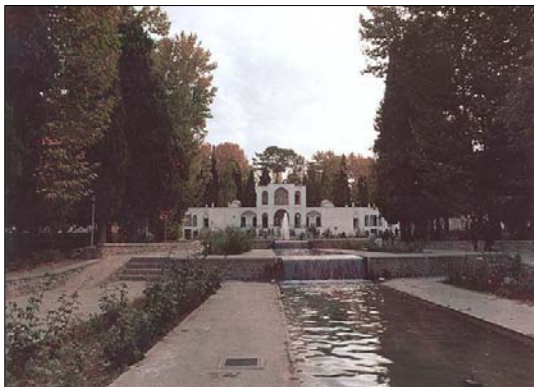
تصویر ۷- باغ شاهزاده ماهان کرمان

باغ شاهزاده ماهان کرمان: درجنوب شرقی شهر کرمان واقع است و بیش از یکصد سال از احداث آن می گذرد (تصویر ۷).