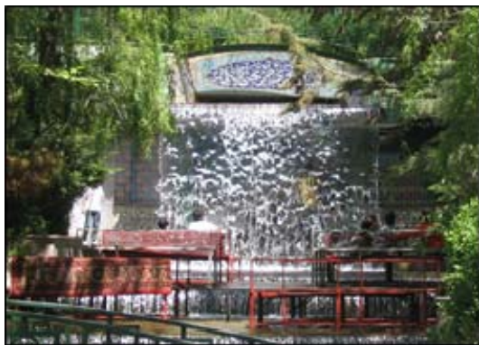
تصویر ۱- آبشار سرچشمه محلات

نوشته و برسرچشمه آب جاری، نصب می کند (تصویر ۱) که در تاثیر پذیری از این عبارت قرآن کریم در باغ سازی جای تردیدی باقی نمی گذارد.