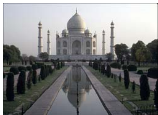
تصویر ۲- باغ تاج محل هندوستان

آن ماری شیمل معتقد است: چهار نهری که از میان باغ های بهشتی میگذرد (۹)، احتمالاً بعدها برای طراحی نهرهایی که از میان باغ های ایران و هند می گذرد به کار معماران آمد (تصویر ۲)، چرا که هر گوشه‌ای از باغ های سلطنتی به نحوی نشان از بهشت دارد و حوض مرکزی در باغ های ایرانی در حکم حوض بهشت بشمار می رود.