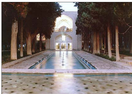
تصاویر ۳ و ۴- پلان و نمای گوشه مرکزی باغ فین

پیرنیا در مورد باغ فین می گوید: در این باغ با آب بازیها شده است. مقدار اعظم آب چشمه سلیمانیه ابتدا از یک اشترگلو بیرون می آید، و از آن جا در حوض هایی در دو طرف پخش می شود و بعد به آبناها و جوی هایی می رسد که فواره های متعدد دارند و بعد از گردش در باغ، خارج شده و به کشتزارها می رود... (۲۷).