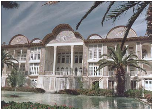
تصویر ۶- باغ ارم شیراز

باغ ارم شیراز: از قرن هشتم هجری وجود داشته و از عصر صفویه به بعد باغ ارم در نوشته های جهانگردان، آباد و باشکوه توصیف شده است (تصویر ۶)، در دوره قاجار، ساختمان