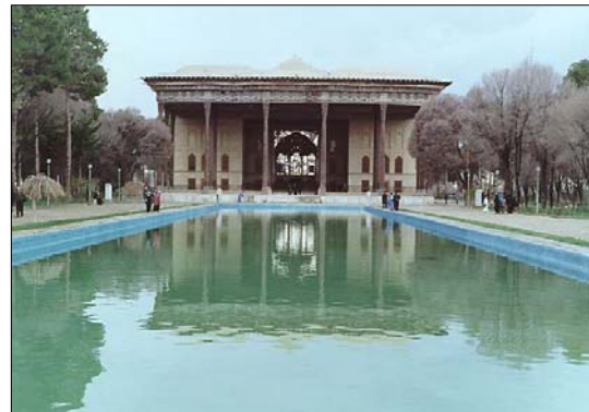
تصویر ۵- باغ چهل ستون اصفهان

دوره صفویه است (تصویر ۵) و جزیی از خیابان زیبا و طویل