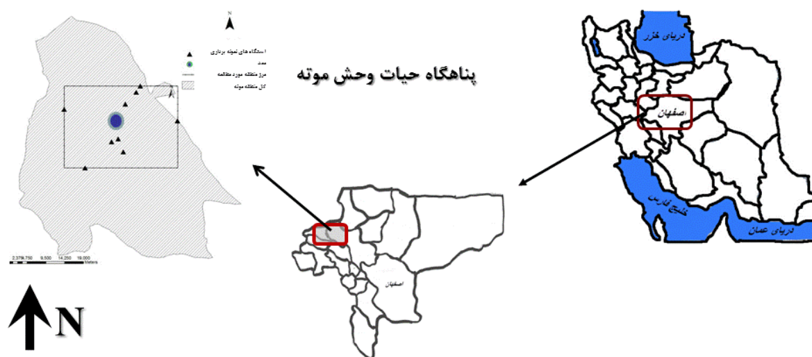
شکل ۱- نقشه منطقه مورد مطالعه

پناهگاه حیات وحش موته، از دیرباز به دلیل دارا بودن منابع طبیعی فراوان و با ارزشی همچون معدن طلا، معادن سنگ مرمریت و تراورتن، معادن خاک‌نسوز، معادن سنگ چینی و ... همواره مورد توجه و تجاوز قرار گرفته است. این منطقه با وسعتی بالغ بر ۲۲۰ هزار هکتار در شمال اصفهان و در ۲۷۰ کیلومتری جنوب تهران قرار دارد. پس از تشکیل کانون شکار ایران در سال ۱۳۴۳، محدوده‌ای با وسعت ۳۴۳۹۴۰ هکتار واقع در حوزه استحفاظی استان‌های اصفهان و مرکزی به عنوان منطقه حفاظت شده موته انتخاب و در سال ۱۳۴۶ به تصویب