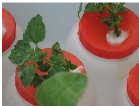
شکل ۲- جذب سزیم از محلول سزیم کلراید توسط

برگ های گیاه خشک گردیده است. محدود ساختن حرکت صعودی فلز از ریشه به برگ ها می تواند یکی از این ساز و کار ها تلقی شود. به همین دلیل در گونه گیاهی مورد آزمایش این تحقیق در دو غلظت اول انتقال سزیم به بخش های هوایی کمتر و گیاه علائمی از مسمومیت ندارد ولی در بالاترین غلظت انتقال سزیم به بخش های هوایی زیاد و در پایان دوره آزمایش اثراتی از خشکی در برگ های گیاه مشاهده گردیده است (شکل ۱). این نتایج می تواند نمایانگر این موضوع باشد که گیاهانی که بر روی ساپت های آلوده به این فلز زندگی می کنند نسبتا به آن مقاومند و در غلظت های پایین تر، فلزات را کمتر به بخش های هوایی منتقل نمی کنند (۲۶). بالاترین شاخص بردباری محاسبه شده برای سزیم 4/2 \pm 0.41 است که نشان می دهد بردباری این گیاه به سزیم کمتر از ۵۰٪ و رویش گیاه در دوره های زمانی طولانی محلول های آلوده به سزیم منجر به مسمومیت گیاهی خواهد شد.