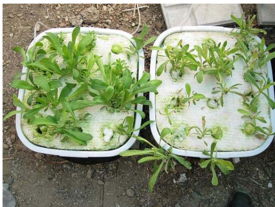
شکل ۱- زرد شدن اندام های هوایی C. alata در اثر

کمبود Fe-EDTA و رویش مجدد اندام های هوایی با