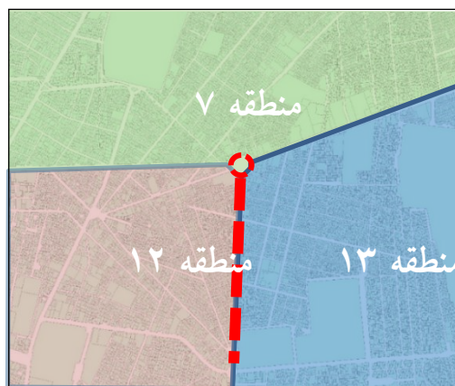
شکل ۱- نقشه موقعیت محدوده مورد مطالعه

صفا تا میدان شهدا برای عبور و مرور وسایل نقلیه بازگشایی شد. در این تحقیق داده ها به صورت پیمایشی و با کمک پرسشنامه ای مبتنی بر چارچوب نظری، شاخص های مورد بررسی و فرضیات تحقیق جمع آوری شده است. جامعه آماری این تحقیق افراد مستقر در مجاورت میدان امام حسین و پیاده راه ۱۷ شهرپور و استفاده کنندگان از این فضاها هستند؛ که ۶ محله نظام آباد، دهقان- گرگان و خواجه نصیر- حقوقی (در منطقه ۷ شهرداری تهران)، صفا و شهید اسدی (در منطقه ۱۳ شهرداری تهران) و محله دروازه شمیران (در منطقه ۱۲ شهرداری تهران) را شامل می شوند. جمعیت جامعه آماری این تحقیق در حدود ۱۱۲۵۱۶ نفر می باشد که حجم نمونه طبق فرمول کوکران ۳۸۳ نفر است. قلمرو زمانی این پژوهش نیز دی ماه ۱۳۹۷ می باشد.