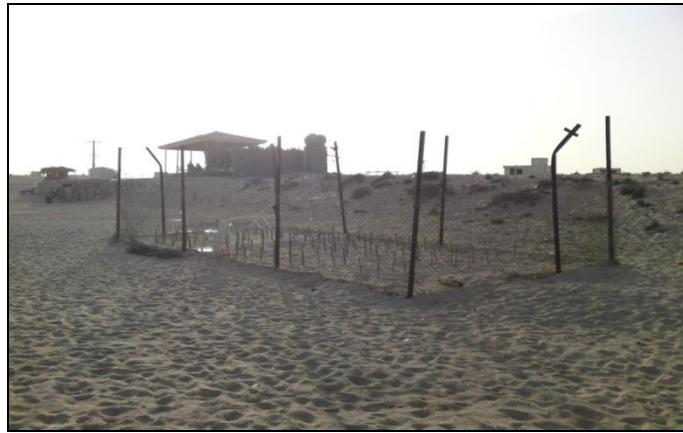
شکل ۲- نمایشی از محل تخم های منتقل شده در ساحل شیب دراز جزیره قشم

لاک پشت های عقابی که از ساحل شیب دراز و شیب پویی به محل حصار انتقال می یابند از آزمون t مستقل استفاده شد. قبلا