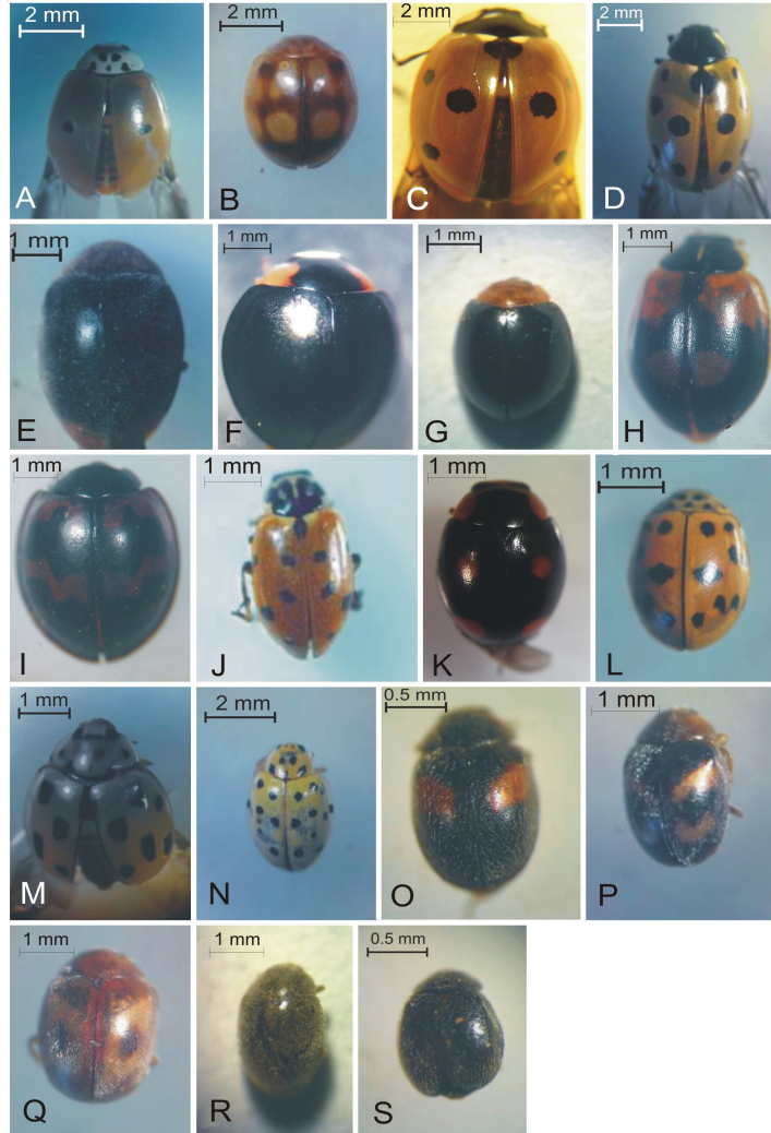
شکل ۱- نمای پشتی کفشدوزک‌های بالغ