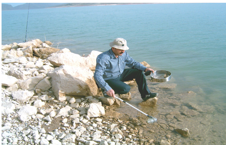
شکل ۳- یکی از روش‌های نمونه‌برداری برای جمع‌آوری حشرات آبی دریاچه سد درودزن