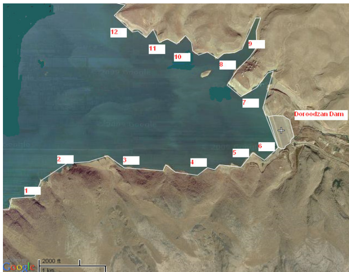
شکل ۲- محل‌های نمونه‌برداری از دریاچه سد درودزن (google earth)