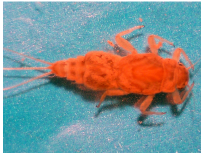
شکل ۶- نایاد خانواده Caenidae