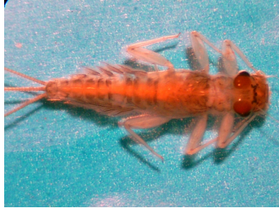
شکل ۴- نایاد خانواده Leptophlebiidae