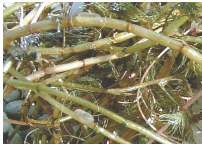
شکل ۵- توده‌های تخم حشرات خانواده Leptophlebiidae روی گیاهان آبی (سد درودزن)