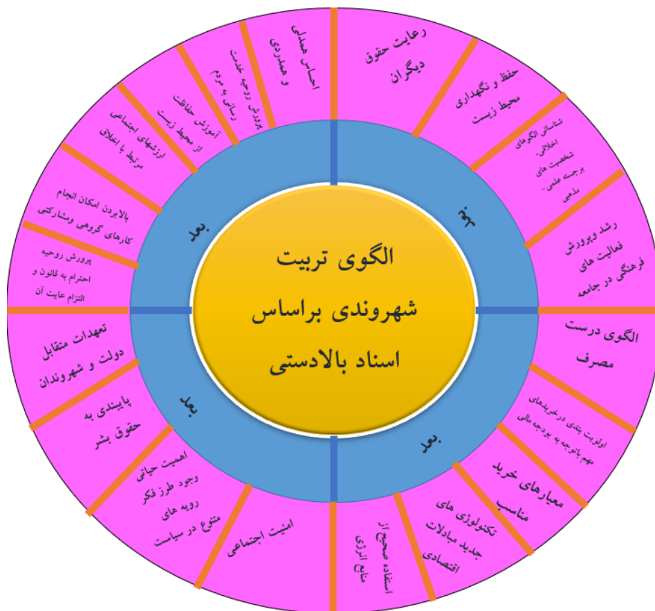
شکل (۲) الگوی تربیت شهروندی براساس اسناد بالادستی