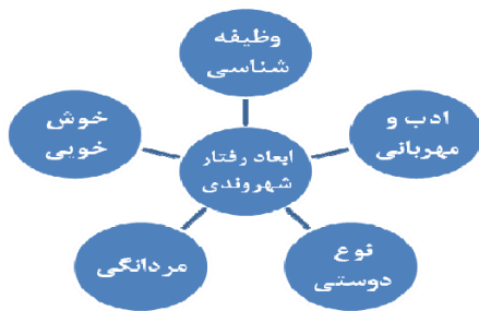
شکل (۱): حیطه‌های رفتار شهروندی سازمانی

رفتارهای نشان‌دهنده مشارکت مسئولانه فرد در فعالیت‌های سازمان هستند (مثلاً فرد کارهایی انجام می‌دهد که در حیطه وظایف‌اش نیستند، اما وجهه سازمان را بالا می‌برند) با جمع این حیطه‌ها رفتار شهروندی سازمانی کلی حاصل می‌شود.