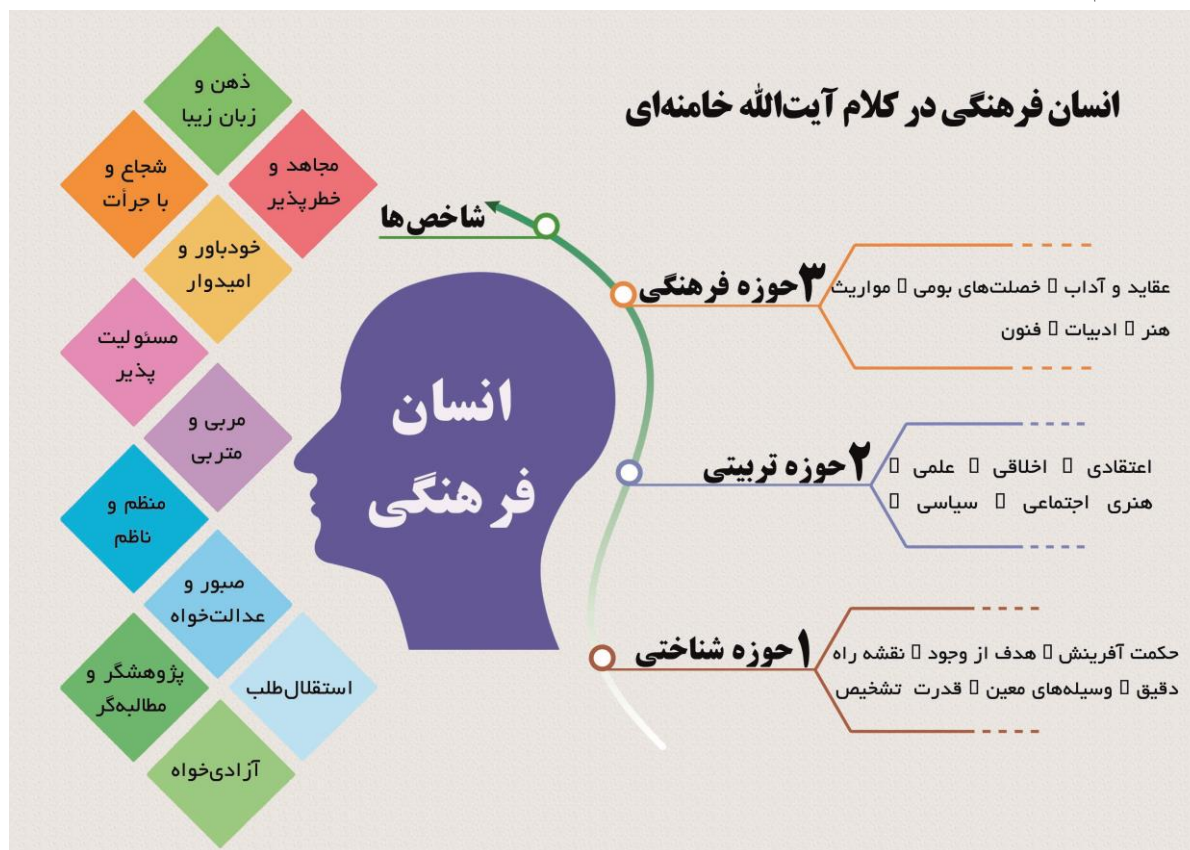
شکل ۲- نمودار شاخصه‌ها و ویژگی‌های انسان فرهنگی در کلام آیت‌الله خامنه‌ای

در این مطالعه با بررسی متون علمی و مرجع در زمینه فرهنگ ابتدا به بررسی نظرات سایر نظریه پردازان از سراسر جهان پرداختیم و از آنجایی که این مطالعه به بررسی انسان فرهنگی بعنوان تعریفی جدید از انسان و فرهنگ پرداخت. همانطور که جلوتر مطرح شد این لغت با معنا و پرمحتوا در بیانات رهبر معظم انقلاب اسلامی دیده شد و محقق را بر آن