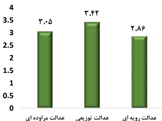
شکل ۲: آزمون فریدمن جهت رتبه‌بندی مؤلفه‌های تأثیرگذار بر چابکی سازمانی با نقش میانجی بهروزی سازمانی