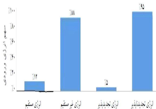
شکل ۲- سهم کل انرژی ورودی، به صورت انرژی مستقیم، غیر مستقیم، تجدید پذیر و تجدید ناپذیر در تولید برنج