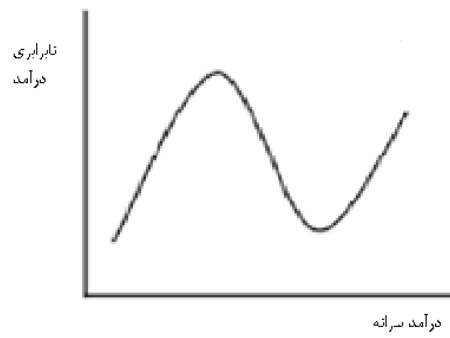
نمودار (۱): رابطه بین درآمد سرانه و نابرابری درآمدی در مناطق شهری