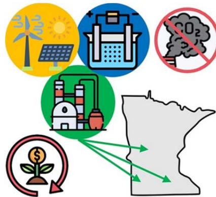
شکل ۲ صنعت کود مبتنی بر انرژی تجدیدپذیر [۵۳]

تولید غذا و تغذیه جمعیتی که به‌سرعت در حال گسترش است، هر دو به‌شدت به نیتروژن، یک ماده مغذی اصلی برای گیاهان، بستگی دارد. مشابه شکل ۲، آمونیاک سبز ممکن است به‌عنوان سوخت زیست‌توده به‌وسیله کارخانه‌های تولید کود برای تولید کودهای نیتروژن استفاده شود [۵۳].