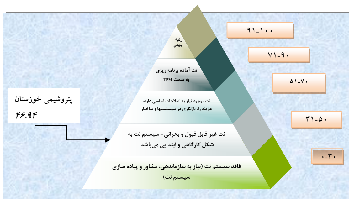
شکل ۳. رتبه سیستم و ساختار نت پتروشیمی خوزستان پس از ممیزی با پرسشنامه ۱۰۰ سوالی