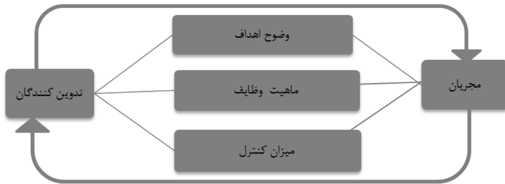
شکل ۲: ارتباط مجریان و خطمشی گذاران

توانائی سیستم برای بقا با ۷٪ در درجه بعدی قرار داشتند. نتایج تحقیق حاکی از آن است که تدوین کنندگان و مجریان قوه قضائیه ضمن اهمیت به سایر معیارهای مرثر بر ارزیابی پیامدهای خطمشی (دستیابی به هدف، عکس العمل خدمت گیرندگان (مراجعات) و حفظ و نگهداری سیستم بحث کارائی خطمشی گذاران را در اولویت قرار دهند. ارزیابی خطمشی، پی بردن به پیامدهای خطمشی است و یا به تعبیر دیگر ارزیابی خطمشی، ارزیابی اثربخشی کلی یک برنامه ملی در دست یابی به اهدافش و یا اثربخشی نسبی دو یا چند برنامه در دستیابی به اهداف مشترک است. در ارزیابی خطمشی علاوه بر خروجی های ملموس، به آثار کوتاه مدت و بلند مدتی که خطمشی در گروه های هدف و غیر هدف خود می گذارد و هزینه های مادی و معنوی آن توجه می شود (دای، ۲۰۰۵).