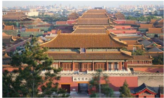
شکل ۲- شهر ممنوعه چین؛ معماری متأثر از عوامل اقلیمی و فنی و بیش سنتی. مأخذ: مهدوی نژاد، ۱۳۸۵، ۱۶۷

(همان، ۶۰) تعبیر می‌شود. آنچه امروز از شهر سنتی مشهود است، بافته پر مایه ایی از صور با انسجام شهری است که به معنای ژرف وحدت در کثرت و حس وحدت در میان پراکندگی شباهت دارد (اردلان و همکاران، ۱۳۸۰، ۱۲۶) (شکل ۲).