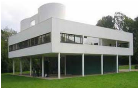
شکل ۳- ویلا ساوا، فرانسه؛ معماری مدرن و مکعب‌های بی‌روح مأخذ: قبادیان، ۱۳۸۲، ۶۲

نیازهای فرهنگی، اجتماعی نهادها نادیده گرفته شد. از دیگر ویژگی‌های این دوران ادعای جهانی مدرنیته بود که سر نزاع با تمام خرده هویت‌های موجود در جهان با آن همه سابقه تاریخی داشت (قطبی، ۱۳۸۷، ۸۰) و همواره در پی «بافتن هویت ویژه برای جهانیان» بود. از این رو عصر مدرن به «عصر ایدئولوژی آفرین» (قبادیان به نقل از رهنورد، ۱۳۸۳، ۹۲) شهرت یافت. انتخاب این لقب برای این دوره دلیلی بر رواج بی‌هویتی و یا به تعبیر بهتر گسترش هویت جهانی دارد. در این دوران قراردادهای اجتماعی مبنی بر نظر اکثریت جایگزین اصول ابلاغ شده الهی در دیدگاه سنتی شدند (شکل ۳).