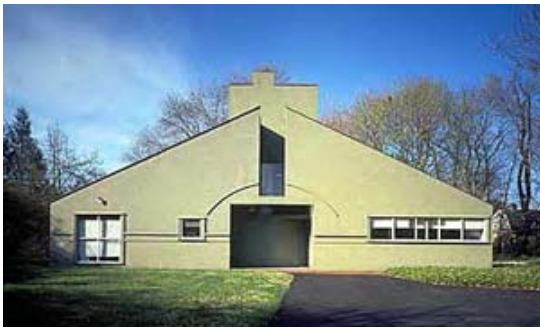
شکل ۴- خانه مادر ونچوری، فیلادلفیا؛ معماری پست مدرن و بکارگیری نماد در ساخت بنا.