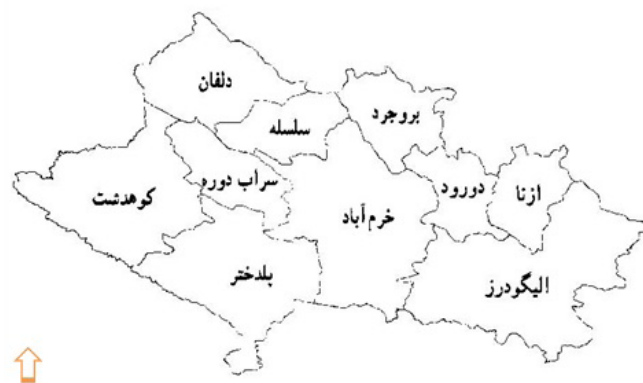
شکل ۱. موقعیت شهرستان‌های استان لرستان (یاری و همکاران، ۱۳۸۹)

مدل‌ها و نرم افزارها و شاخص‌های مورد استفاده در پژوهش: در تحقیق حاضر از مدل‌های ضریب جینی ۶ ، ضریب