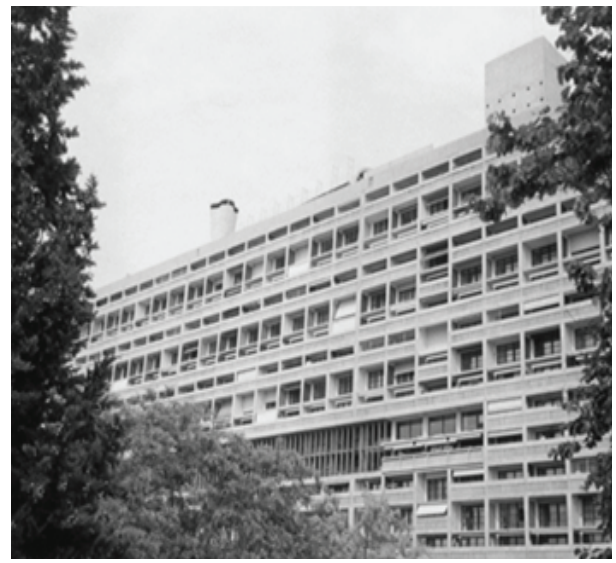
شکل ۱. مجتمع مسکونی سیت رادیوز، مارسی، فرانسه