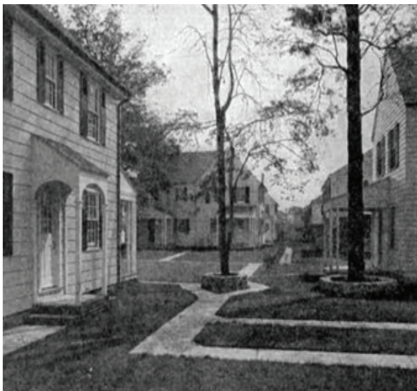
شکل ۲. رادبرن، نیوجرسی

پراکندگی کالبدی شهرها، نزول ساختار اجتماعی و نا امنی در محله ها، استفاده نامطلوب از زمین، تنزل کیفی محیط شهری بخشی از مشکلات شهری موجود در این بازه زمانی است. جنبش های سازمان یافته در پی پاسخی به فقدان هویت محیط های شهری، مصرف زمین های در حال توسعه و یا بافت های فرسوده مراکز شهری، نابودی زیستگاه های بومی، اتکاء و وابستگی بیش از اندازه به سوخت های فسیلی و افزایش