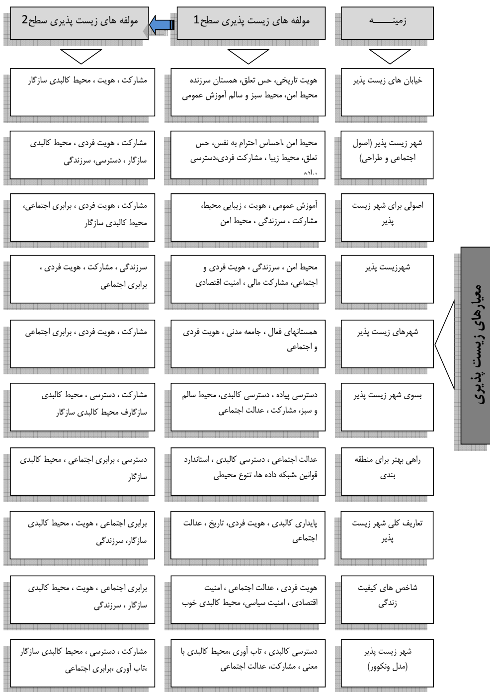
شکل ۱. تحلیل قیاسی معیارهای زیست پذیری برای دستیابی به مدل مفهومی

به نظر می رسد. از دیدگاه «مرسر» اصطلاح کیفیت زیست ۳۴ با اصطلاح کیفیت زندگی متفاوت است و در واقع منظور مرسر کیفیت زیست بوده و این شاخص ها به صورت عینی، خنثی و بدون تعصب بیان شده اند. کیفیت زندگی درباره حالت احساسی شخص و زندگی