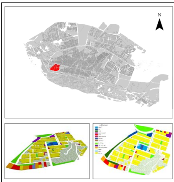
شکل ۲. موقعیت محدوده مورد مطالعه در شهر زنجان

شهر زنجان در محدوده شمال غربی ایران واقع شده است. این شهر دارای محلات قدیمی و جدیدی در بطن خویش است. این محلات که به دو بخش محلات قدیمی و محلات جدید تقسیم می‌گردند، وجه تمایزشان در شیوه ساماندهی درون محله‌ای، معابر متفاوت، پیوستگی فضایی و فرسودگی کالبدی در محلات قدیمی و در محلات جدید بر شیوه توسعه محله‌ای وارد شده در دهه ۶۰ بر مبنای الگوی برون‌زا در