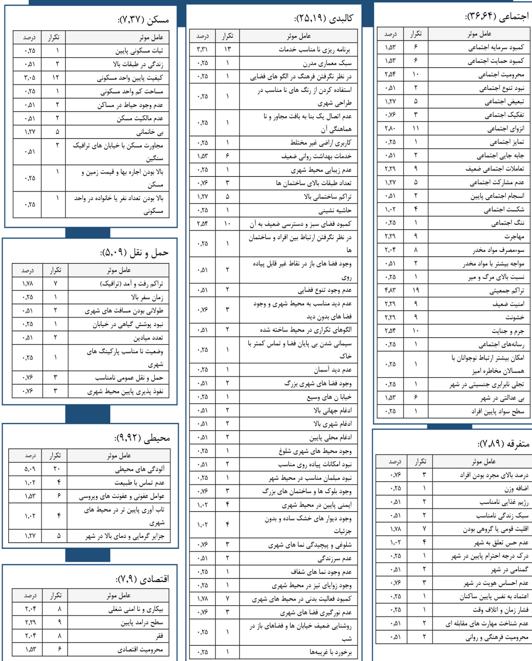
شکل ۱. تشریح رابطه شهر، سلامت، سلامت روان و استرس.