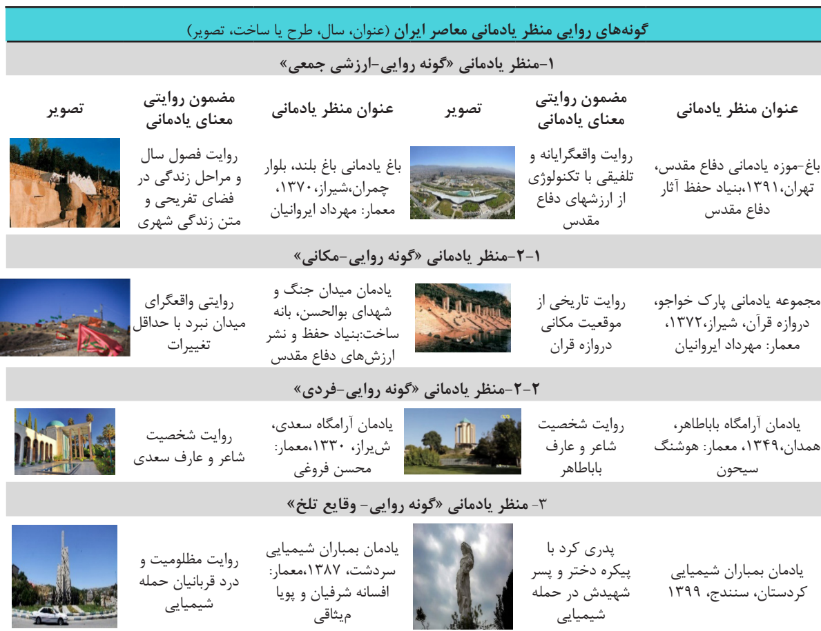
Table 3. Narrative types of the contemporary memorial landscape of Iran.

جدول ۳. گونه‌های روایی منظر یادمانی معاصر ایران.