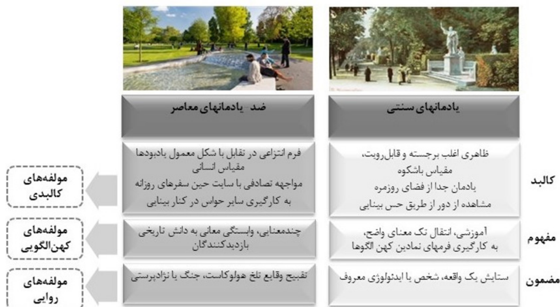
شکل ۱. مؤلفه‌های روایی، کالبدی و آرکی‌تایپی منظر یادمانی معاصر

در چند دهه اخیر در زمینه مطالعه یادمان‌های معاصر، اصطلاح «ضد-یادمان» ۹ با نوشته‌های جیمز یانگ ۱۰ در زمینه یادمان‌گرایی