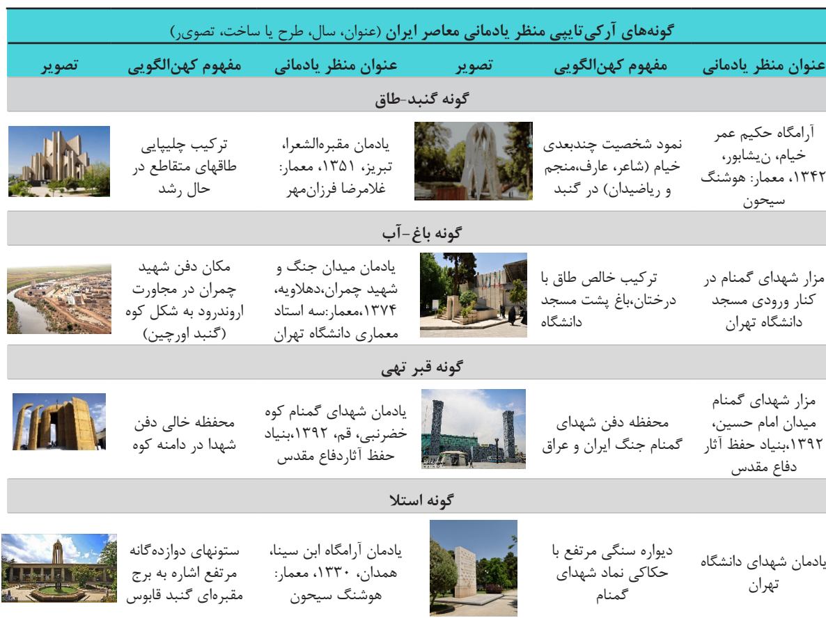
Table 2. Archetypal types of contemporary Iranian memorial landscape.

جدول ۲. گونه‌های کهن‌الگویی منظر یادمانی معاصر ایران.