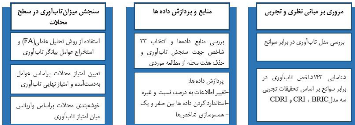
شکل ۱. روش پژوهش

درمجموع مدل‌های ارزیابی تاب‌آوری با استفاده از معیارها و داده‌های قراردادی به ارزیابی کمی تاب‌آوری بر اساس وضع موجود (تاب‌آوری ذاتی) در محدوده‌های جغرافیایی مختلف و یا سنجش نتایج و تغییرات در طول زمان در یک محدوده خاص می‌پردازند. این مدل‌ها تاب‌آوری را به‌عنوان مجموعه‌ای از ظرفیت‌های تطابق‌پذیر در نظر می‌گیرند.