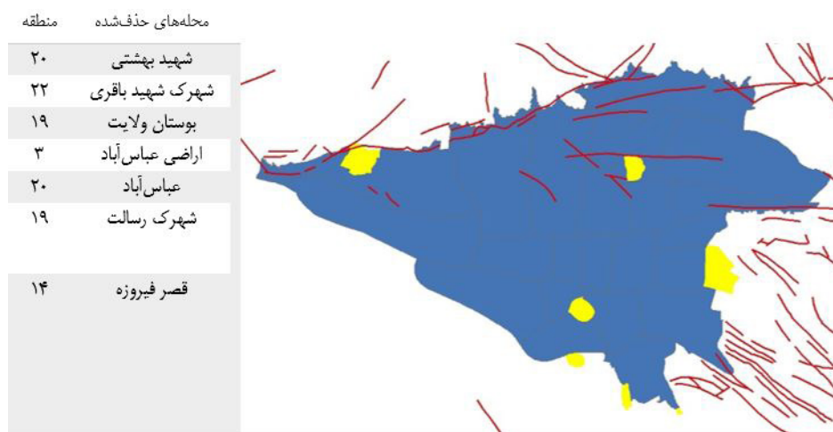
شکل ۲. محلات مورد مطالعه و موقعیت گسل‌ها در شهر تهران

شاخص‌های ارائه‌شده در ابعاد تاب‌آوری باید به‌صورت همه‌جانبه در مطالعات مربوط به تاب‌آوری مدنظر قرار گیرد تا پوشش‌دهنده مسئله (ارزیابی تاب‌آوری در برابر سوانح در سطح محلات شهر تهران) باشد؛ بنابراین بر اساس مقیاس مطالعه، امکان‌پذیری، عملیاتی‌سازی و همچنین دسترسی به داده‌ها و از سوی دیگر اقتضای جامعه مطالعه شده، شاخص‌ها از همه ابعاد انتخاب‌شده‌اند ۸ . درنهایت آن‌چنان‌که در جدول ۲ آورده شده است، ۳۴ شاخص از میان ۱۴۳ شاخص شناسایی‌شده از سه مدل مذکور، بر اساس داده‌های سرشماری سال ۱۳۹۰، اطلاعات مکانی کاربری شهر تهران سال ۱۳۹۲، مطالعات